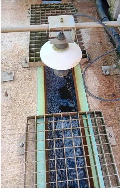
Remous en surface du canal de mesure