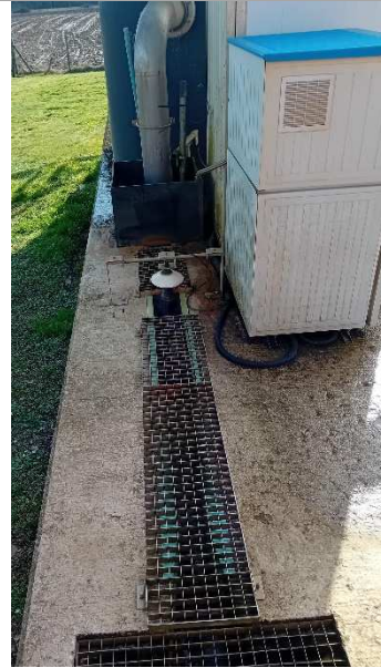
Sortie station avant exutoire final