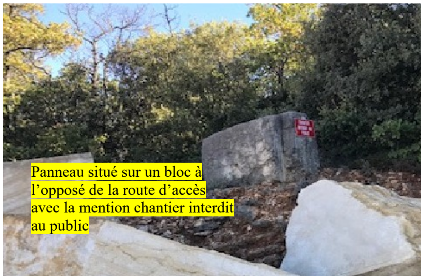
Panneau situé sur un bloc à l'opposé de la route d'accès avec la mention chantier interdit au public

Observations : L'exploitant doit, sous un délai de 1 mois :