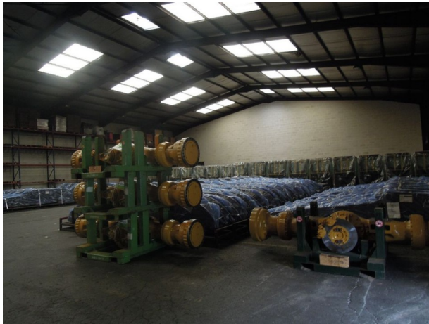
Stockage au sol sur la zone et en rack sur la zone d'emballage du hall B