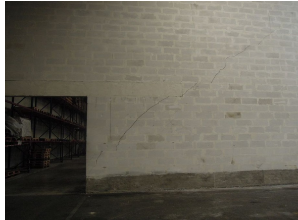
Ouverture dans le mur dit « coupe-feu » entre les deux zones du hall B.

Les zones de stockage du hall B ne correspondent pas aux zones déclarées dans le dossier de déclaration.