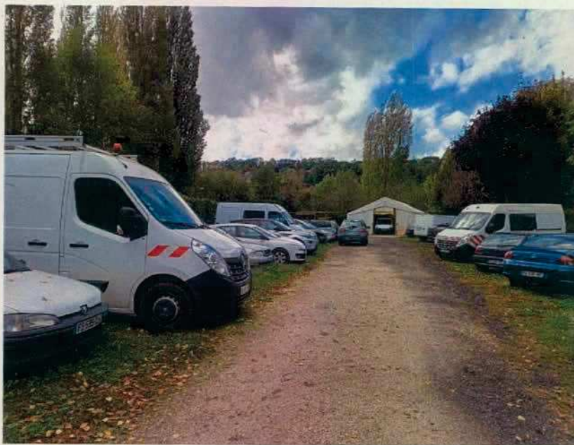
Cours avec barnum faisant office d'atelier

N°1 : Situation administrative - positionnement dans la rubrique n°2930-1