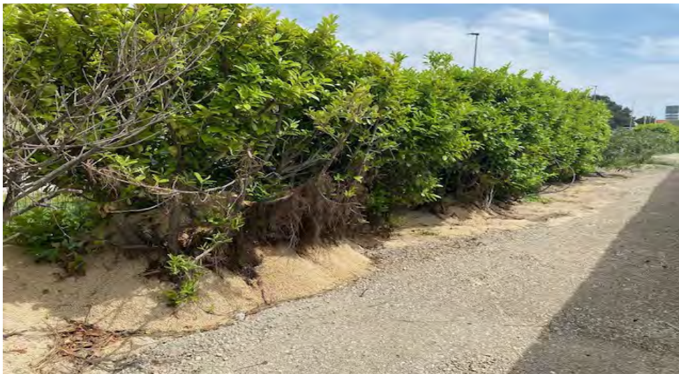
Photo n°3 – zone appartenant à la société MAT'ILD suite au nouveau plan de bornage du 24/11/2024 et toujours dans le périmètre ICPE de la société Calcaires Régionaux