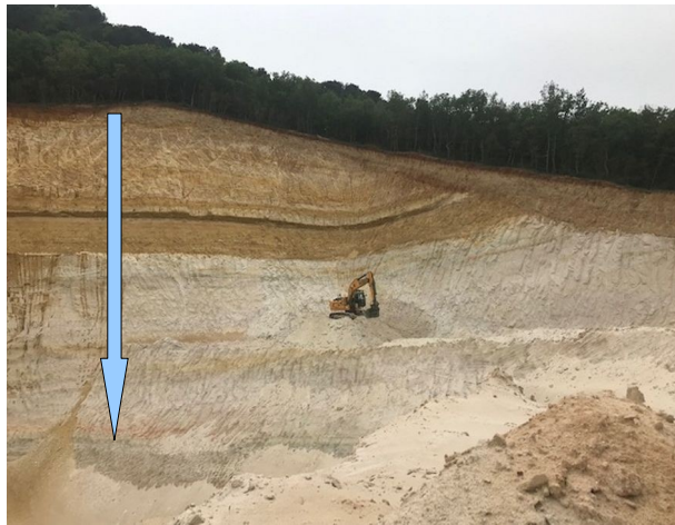
Vue aérienne de la carrière de Derrière Montmou Est et Derrière Montmou Ouest sise Mornas