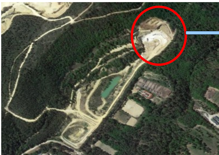
Vue aérienne de la zone exploitée en 2023

La société RICARD n'exploite pas le site conformément aux éléments techniques contenus dans le dossier de demande d'autorisation présenté le 22/04/2011 : en effet, celui-ci prévoit une hauteur de fronts de 14 mètres, et des gradins de 4 à 5 m en phase d'exploitation (et 8 m à l'issue des opérations de remise en état), afin s'assurer la stabilité du massif. Par ailleurs, l'exploitant n'a pas informé Mme la Préfète de cette modification des conditions d'exploitation préalablement à sa mise en oeuvre. En particulier, aucune étude géotechnique garantissant la stabilité du massif n'a été produite par la société Ricard.