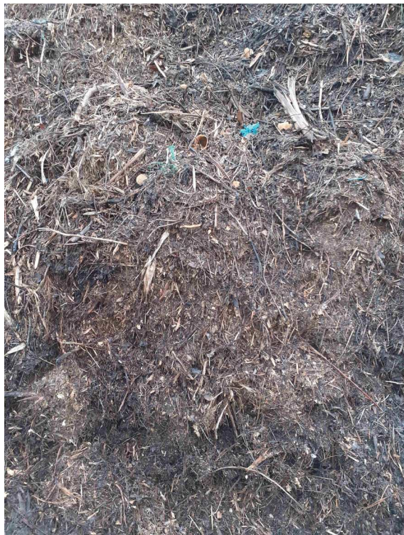
déchets divers dans un tas de compost