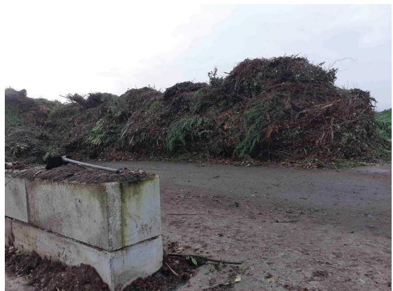
déchets verts avant broyage2