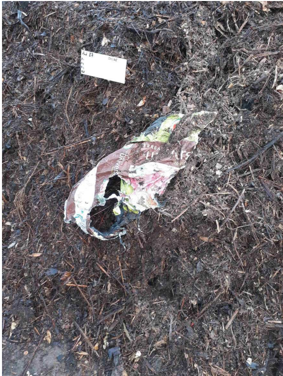
sac de terreau présent dans les déchets verts