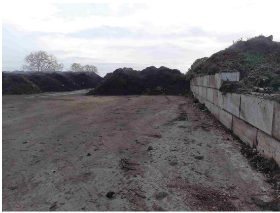
espace réservé au broyage