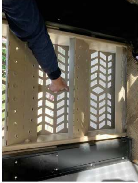
Photo n° 1 : possibilité de passer une main à l'extérieur du camion, voire un bras d'enfant