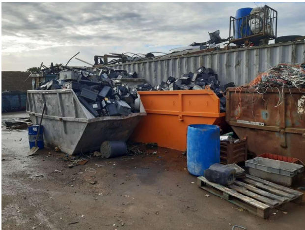
Stockage de batteries