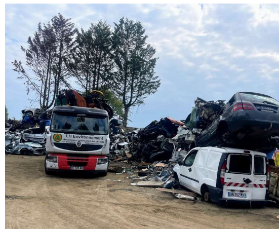
Empilement de VHU dépollués réduit à moins de 3m de haut le 26/09/25