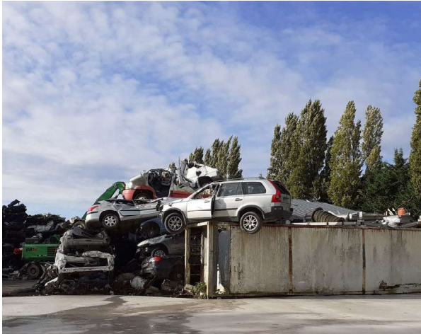
Empilement de VHU « dépollués »