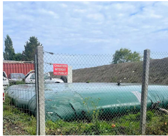
Bâche incendie réparée et remplie le 26/09/25