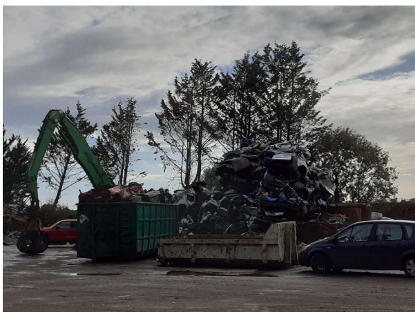
Empilement de VHU dépollués sur près de 6m de haut le 22/09/25