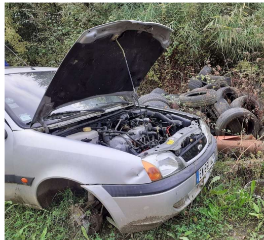
Fluide, vitrages et moteur encore présents sur un VHU dépollué