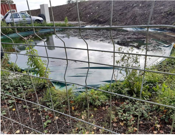
Bâche incendie hors d'usage le 22/09/25