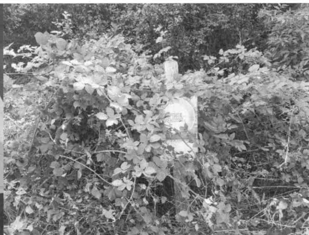
Panneau d'interdiction d'accès