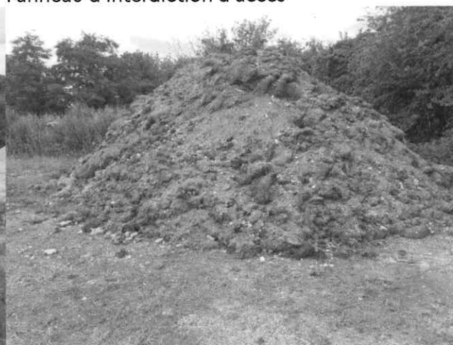
Stockage de terres végétales supérieur à 2m