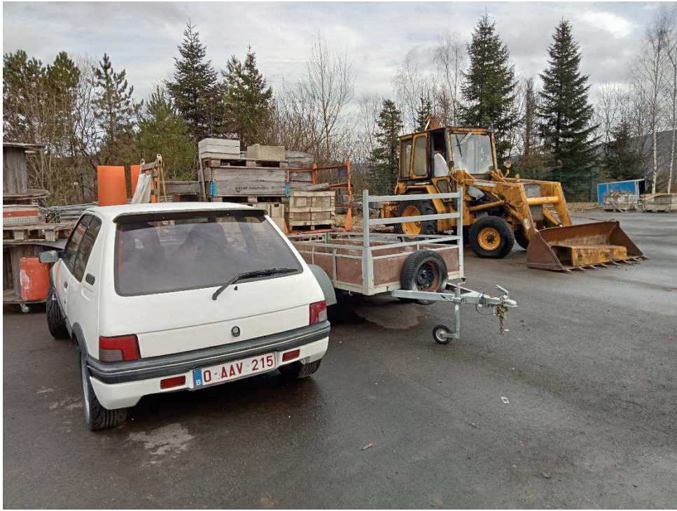
Véhicule sans moteur (voiture blanche), nouvellement présent sur le site