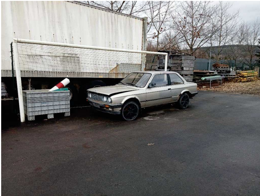
Véhicule nouvellement présent sur le site