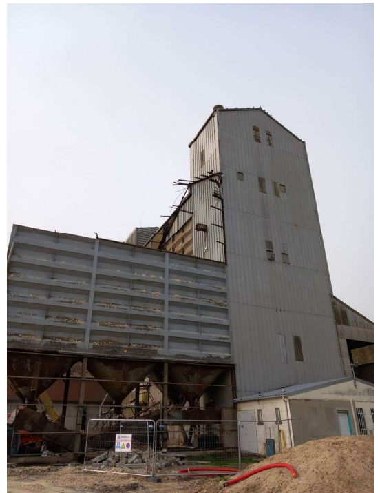
Figure 4: Vue de la zone de démolition.