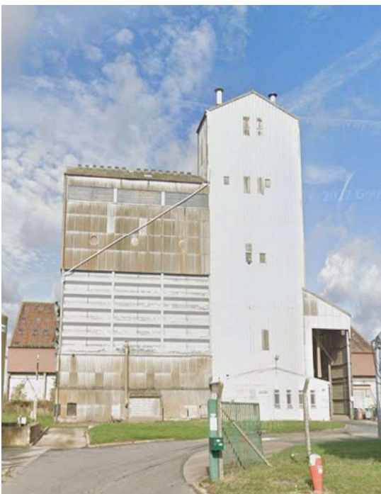
Figure 3 Illustration avant travaux.