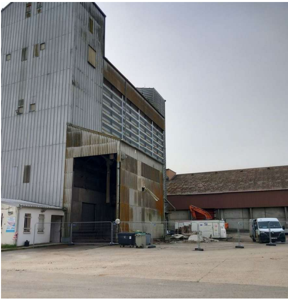
Figure 1: Prise de vue du chantier coté cour.