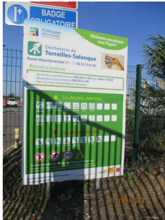
Panneau implanté à l'unique entrée de la déchèterie de Torréilles

Photographies prises par l'inspection des installations classées lors du contrôle du 04/09/2023 de la déchèterie de Torréilles que PERPIGNAN MÉDITERRANÉE MÉTROPOLE COMMUNAUTÉ URBAINE exploite route départementale n° 11, lieu-dit « El Clots d'en Garriu » à Torréilles (66440)