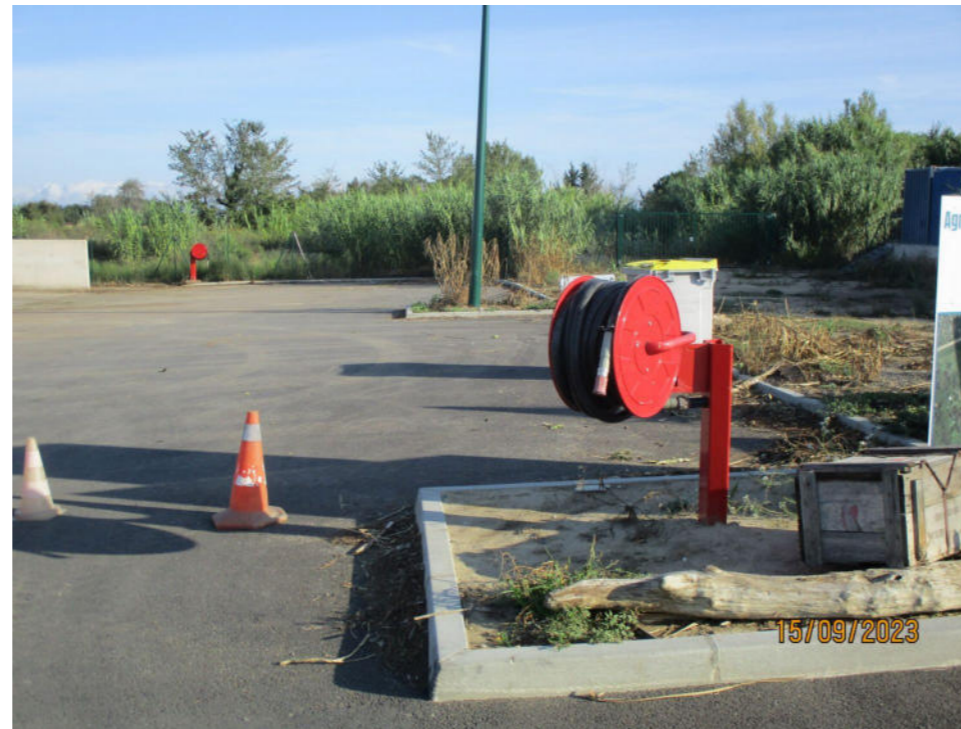
2 robinets d'incendie armé (au 1 er et en arrière plan). Le 3 e se trouve dans le dos de l'inspecteur de l'environnement ayant pris la photographie