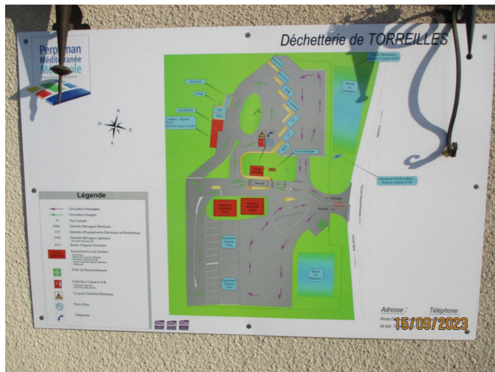
Plan de la déchèterie de Torréilles apposé sur le local d'accueil des usagers