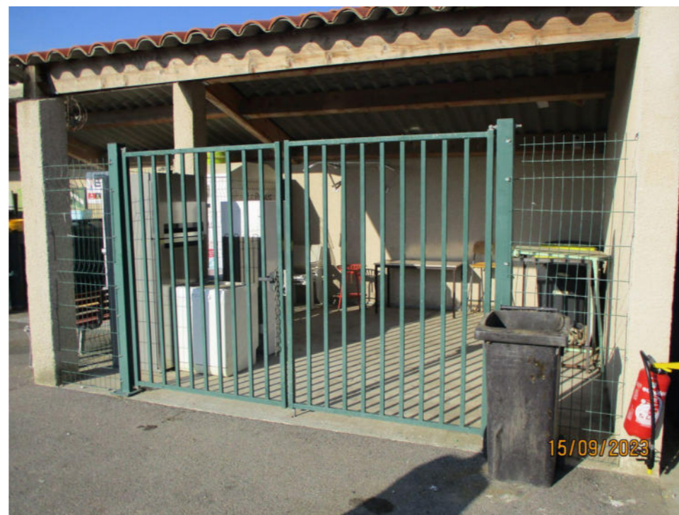
Zone de dépôt pour le réemploi