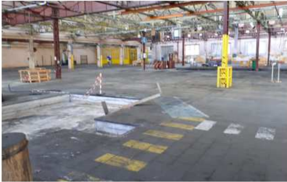
Locaux industriels vidés