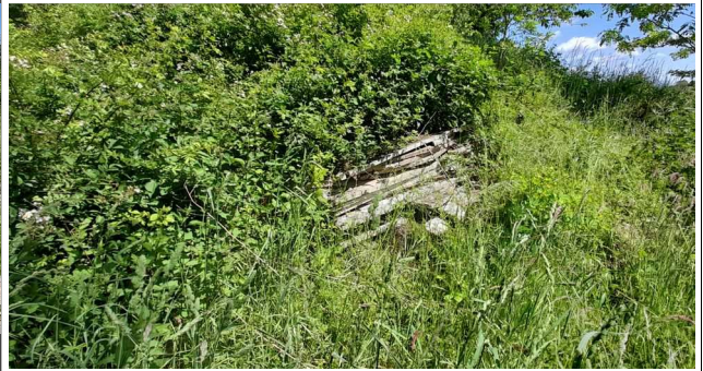
Vue des déchets de béton envahis par la végétation