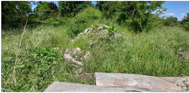
Vue des déchets de bois au premier plan et déchets inertes au second plan