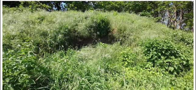
Vue du stock d'inertes végétalisé