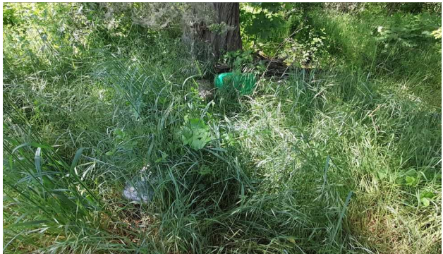
Vue des bidons restés sur place