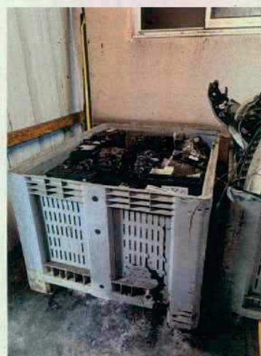
Figure 4: Stockage des batteries non étanche

Les batteries ne sont pas entreposées dans des conteneurs spécifiques fermés et étanches, munis de rétention (cf. photo).