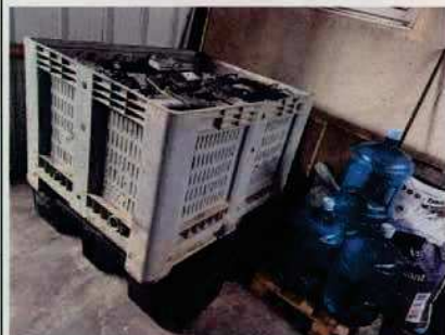
Figure 7: Batteries sur rétention

Demande à formuler à l'exploitant à la suite du constat :