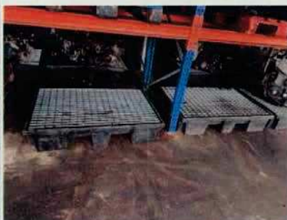
Figure 5: Moteurs sur bacs étanches (bis)