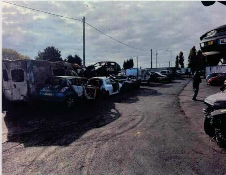
Figure 2: voie engins et aire de retournement encombrés

Par courriel du 16/10/2025, l'exploitant transmet les photos du site justifiant l'accès libre de la voie engins et de l'aire de retournement.