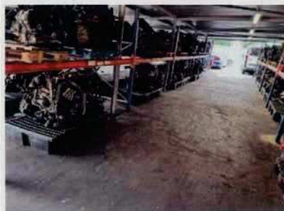
Figure 6: Moteurs sur bacs étanches

Par courriel du 16/10/2025, l'exploitant transmet des photos justifiant la mise en place de rétention pour les moteurs et les batteries.