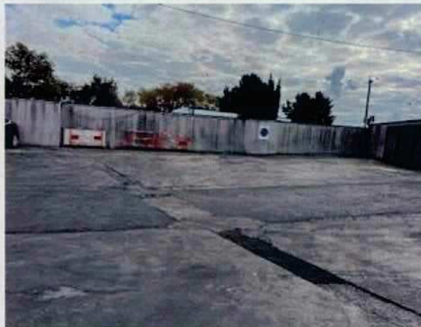
Figure 3: aire de retournement accessible

Par courriel du 16/10/2025, l'exploitant transmet les photos du site justifiant l'accès libre de la voie engins et de l'aire de retournement.