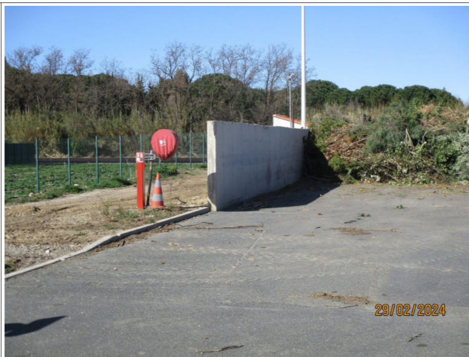
Vue d'un des deux RIA implantés sur le site d'exploitation de la déchèterie