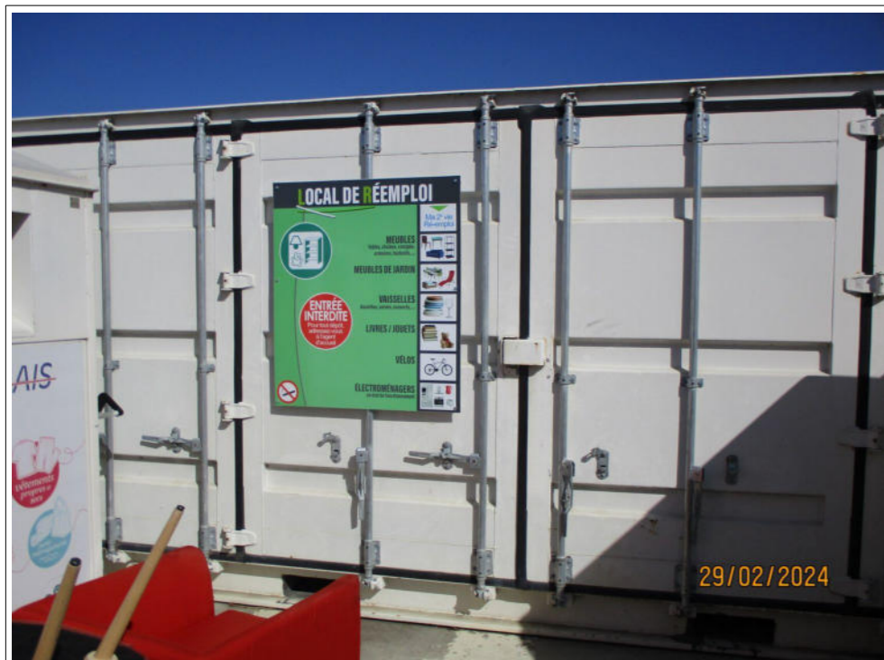
Panneau figurant sur le conteneur contenant les objets entreposés pour le ré-emploi, mentionnant de s'adresser à l'accueil avant tout dépôt