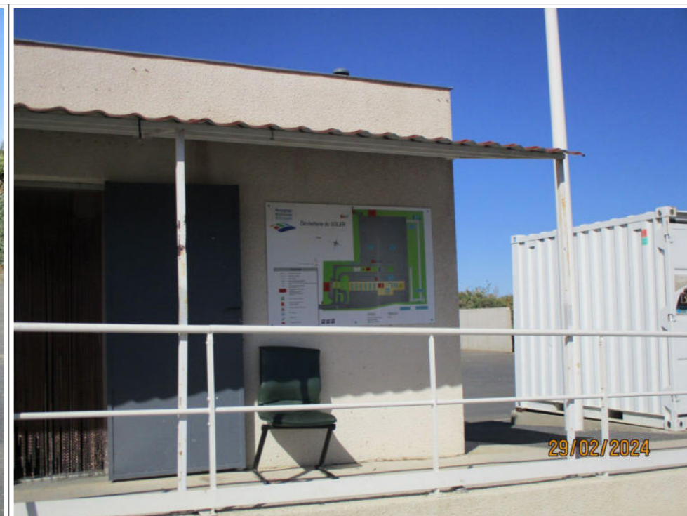
Plan destiné à faciliter l'intervention des services de secours et d'incendie, affiché sur le local d'accueil des usagers de la déchèterie