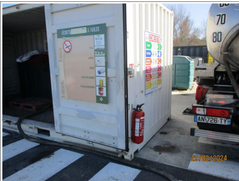
Extincteur à poudre se trouvant à l'extérieur du conteneur des déchets d'huiles de vidange (ou conteneur des déchets dangereux spécifiques)