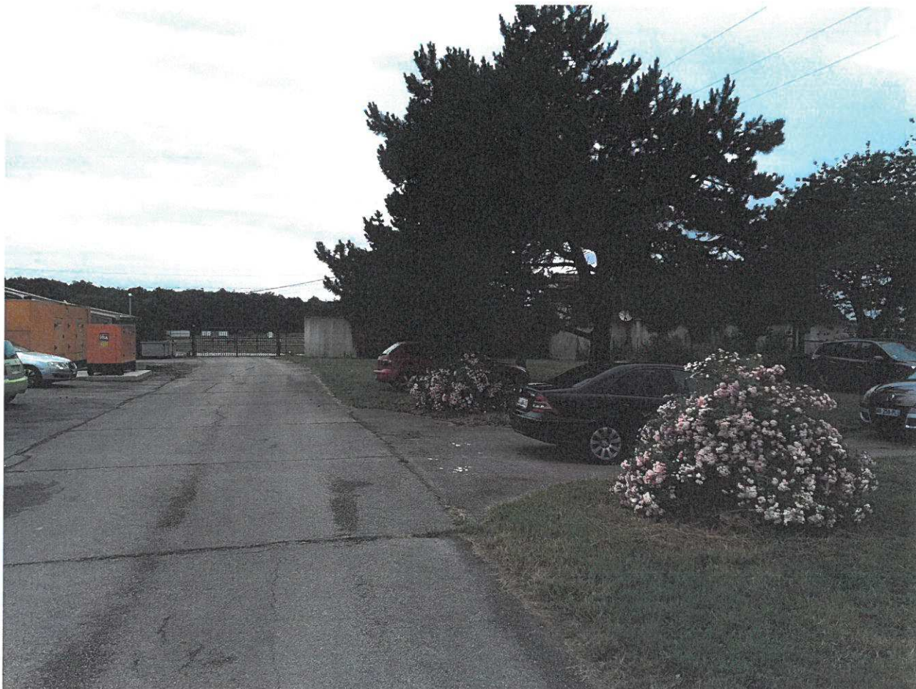
Parking du personnel