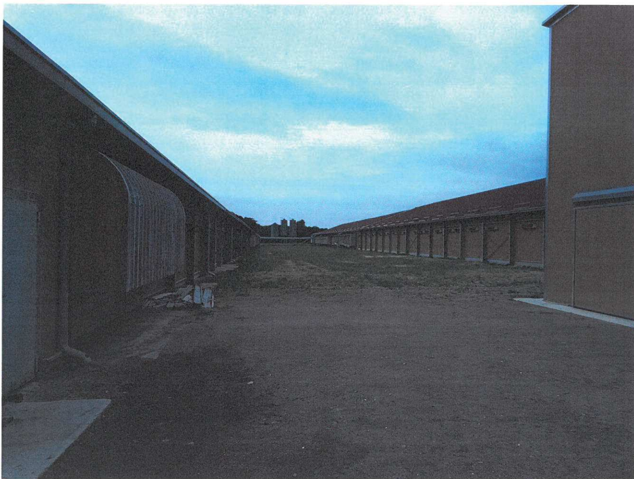
Abords extérieurs entre les bâtiments d'élevage