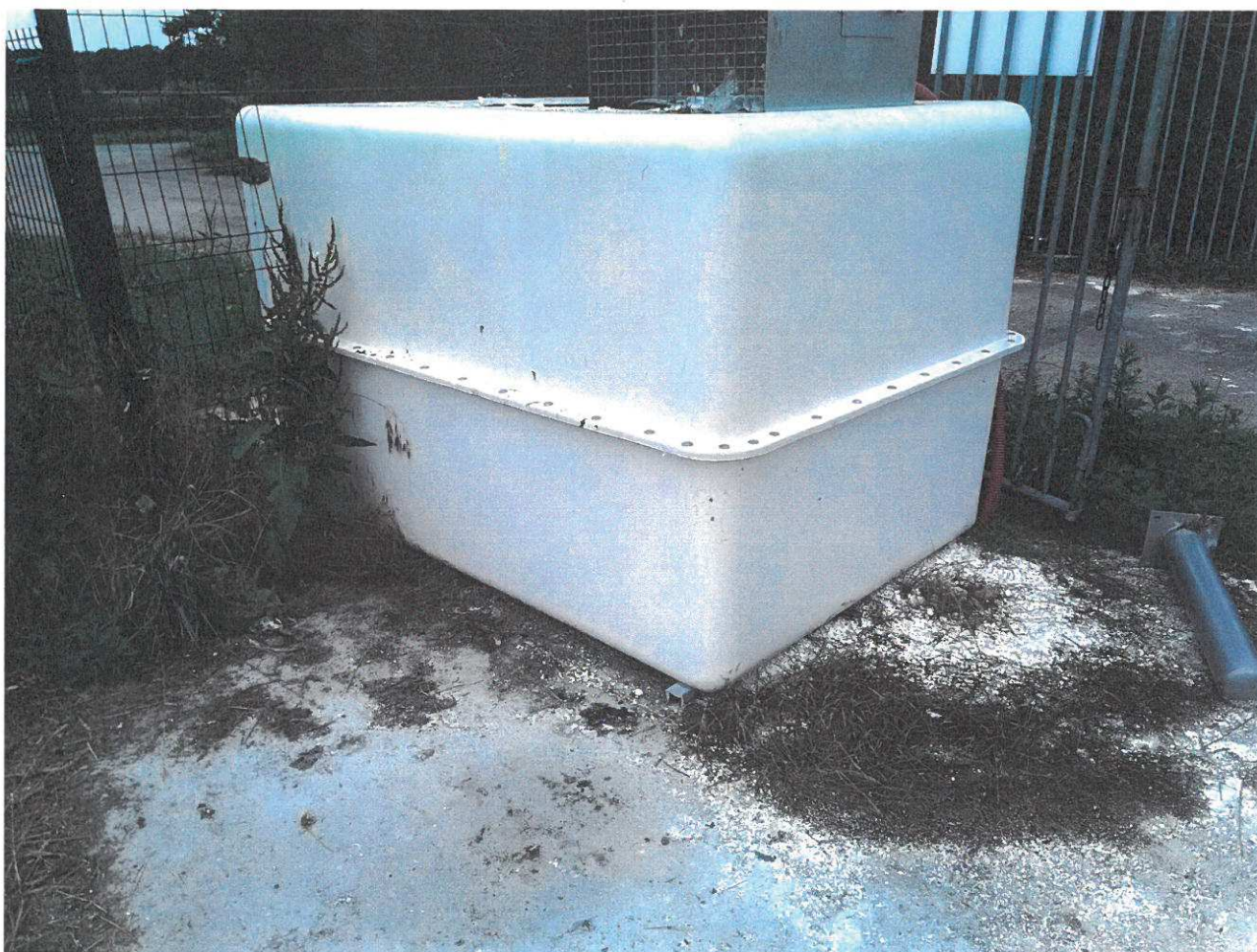
Chambre frigorifique de stockage des déchets destinés à l'équarrissage