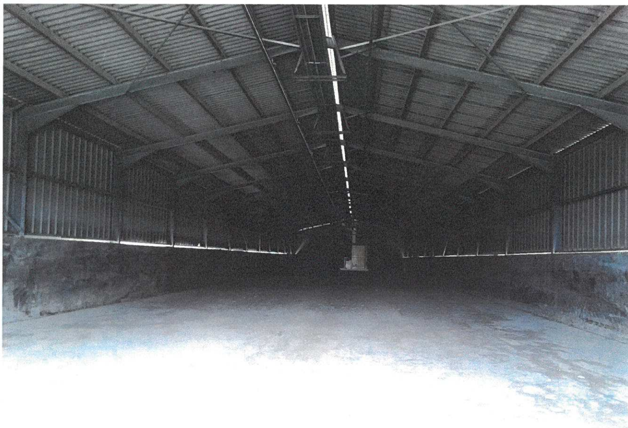
Hangar de stockage des fientes sèches de volailles