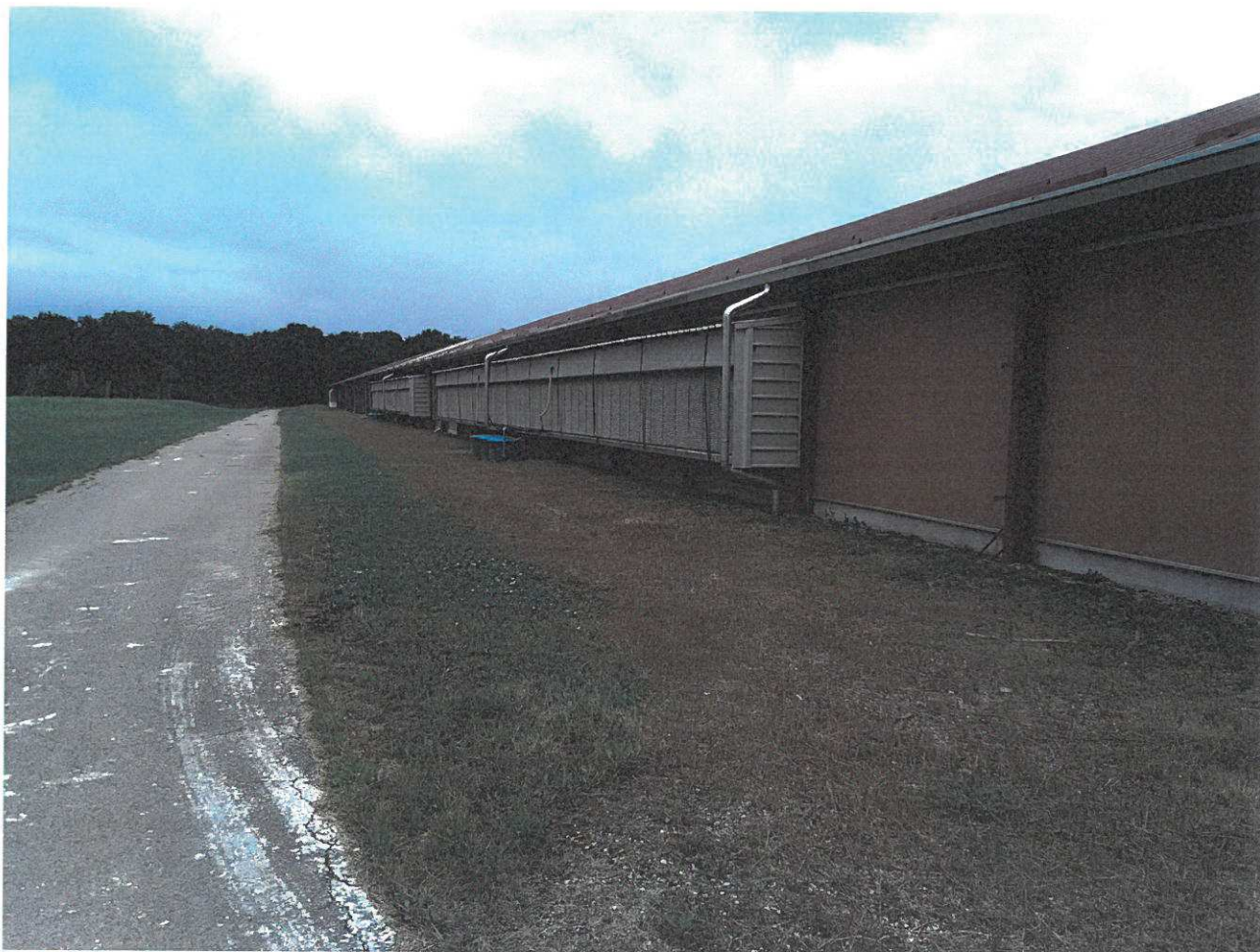
Abords extérieurs du bâtiment d'élevage P3 (face nord-est)