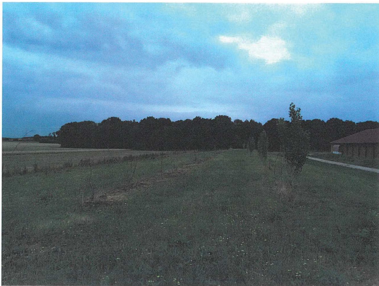
Aménagements paysagers à consolider - face nord ouest du site d'élevage