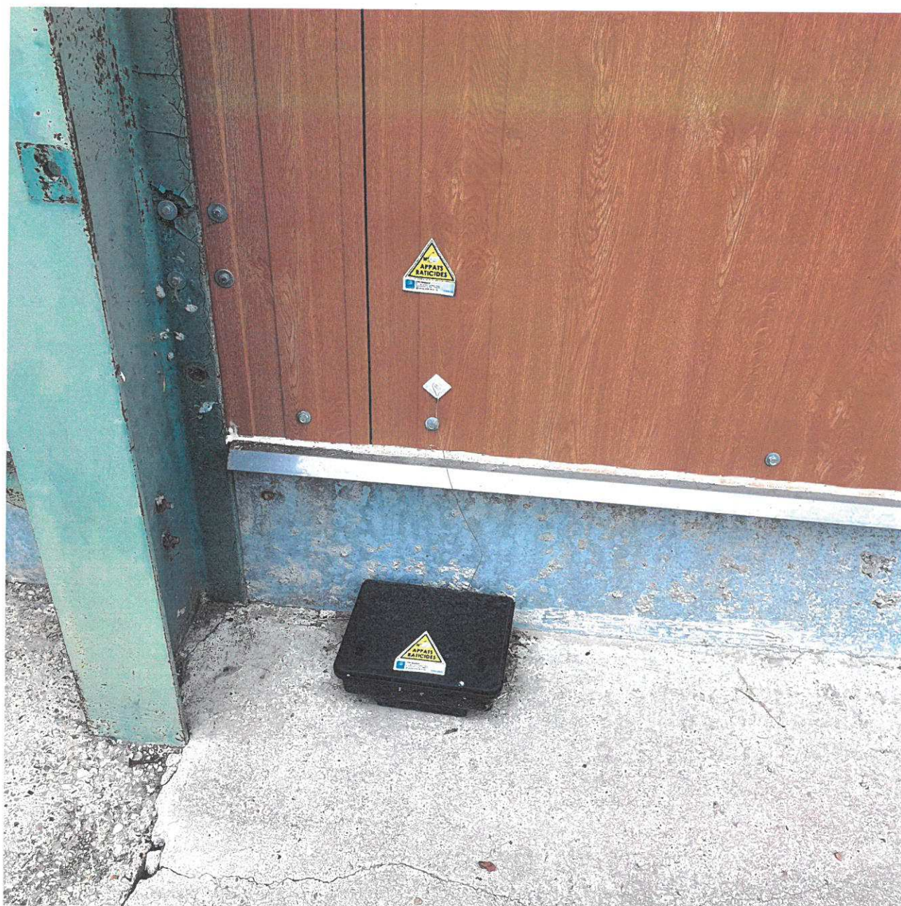
Un des postes d'appatage contre les rongeurs, situé autour des bâtiments d'élevage