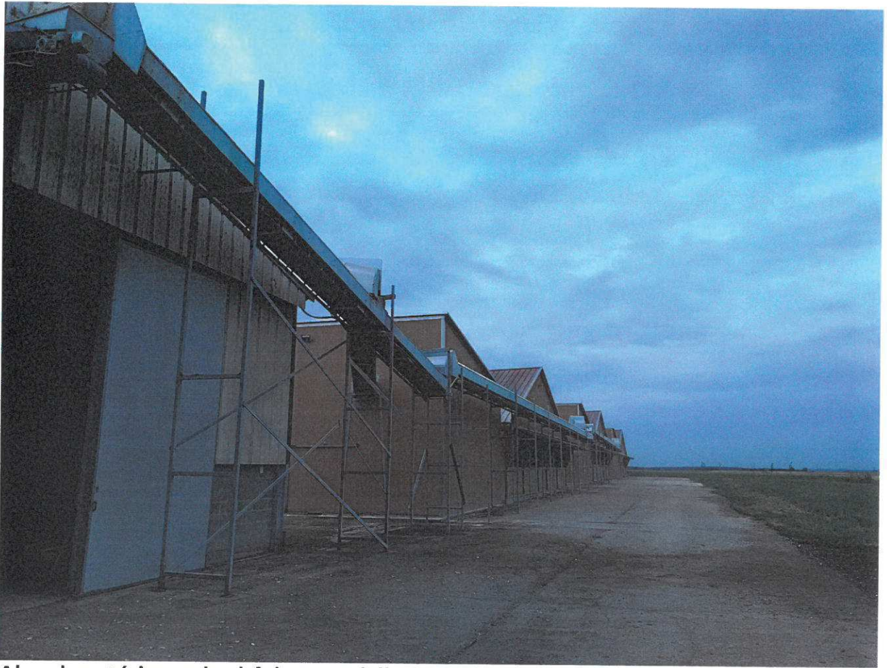
Abords extérieurs des bâtiments d'élevage : face sud-est