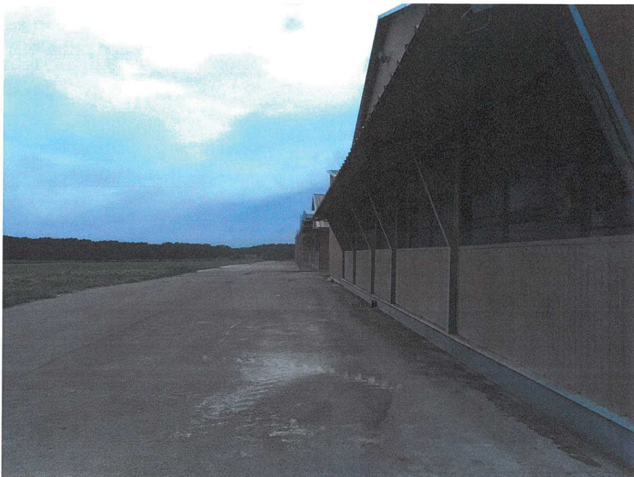
Abords extérieurs des bâtiments d'élevage : face sud-est