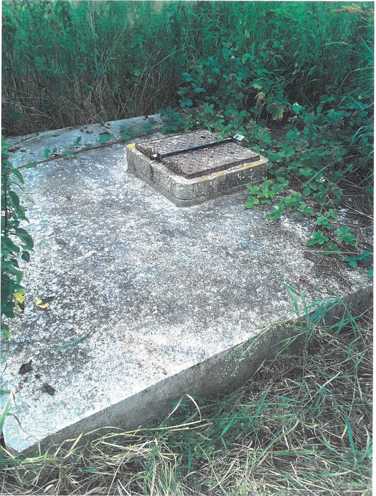
Forage de l'exploitation

Annexe au rapport de l'inspection des installations classées Visite d'inspection du 22/06/2023 : prises de vues SAS LIOT La Haute Boulaie 27490 AUTHEUIL-AUTHOUILLET