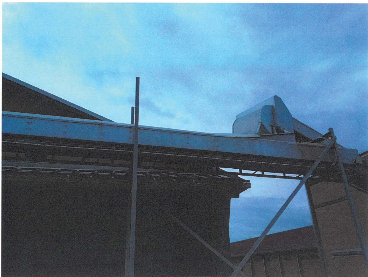
Convoyeur extérieur des fientes sèches de volailles