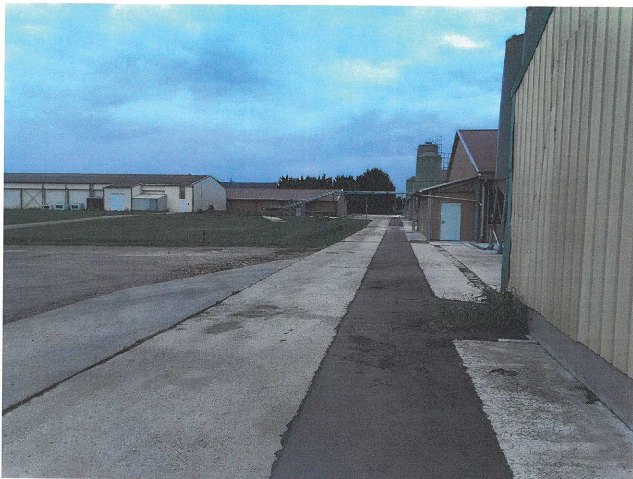
Abords extérieurs des bâtiments d'élevage : face nord-ouest