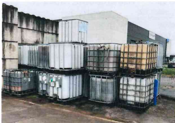
Figure 1: stockage de jus de saumure

L'inspection constate de nombreux stockages de biodéchets sur site mais hors du bâtiment. Le plan du site, présenté par l'exploitant, prévoit que tous les biodéchets sont stockés dans le bâtiment. Il n'est pas à jour. Ceci est une non conformité.