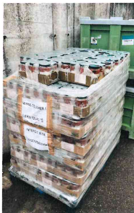
Figure 2: stockage de ratatouille