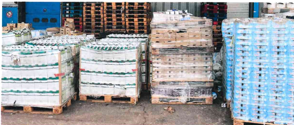
Figure 5: stockage de produits laitiers