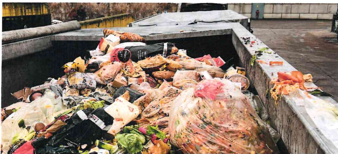
Figure 6: bennes de bio déchets