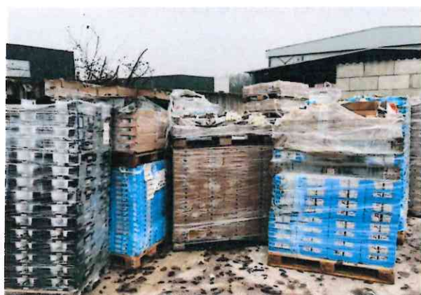
Figure 3: stockage de produits laitiers