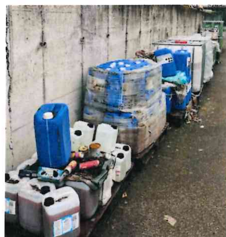
Figure 4: stockage de colorant alimentaire