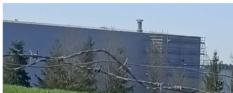
bâtiment URAMUL au Nord nouveau bardage