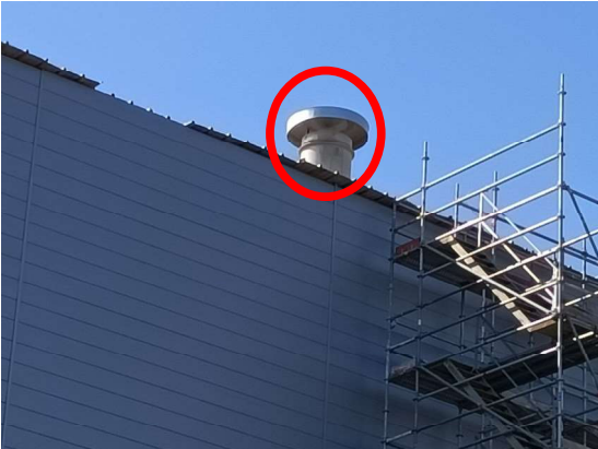
bardage et silencieux