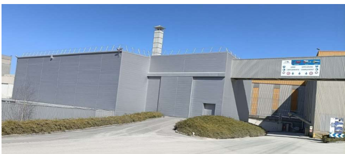
bâtiment sud nouveau bardage