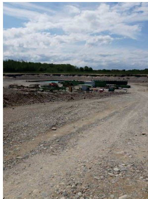
Zone 1b (mai 2023)

Il a été constaté en mai 2023, que la partie nord de la carrière n'a pas été totalement exploitée et que la drague n'a pas encore été installée dans la partie en extension.