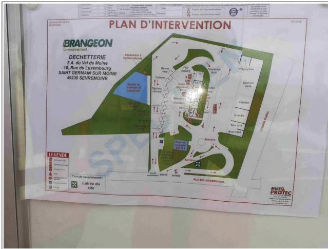
Plan d'intervention et stockages