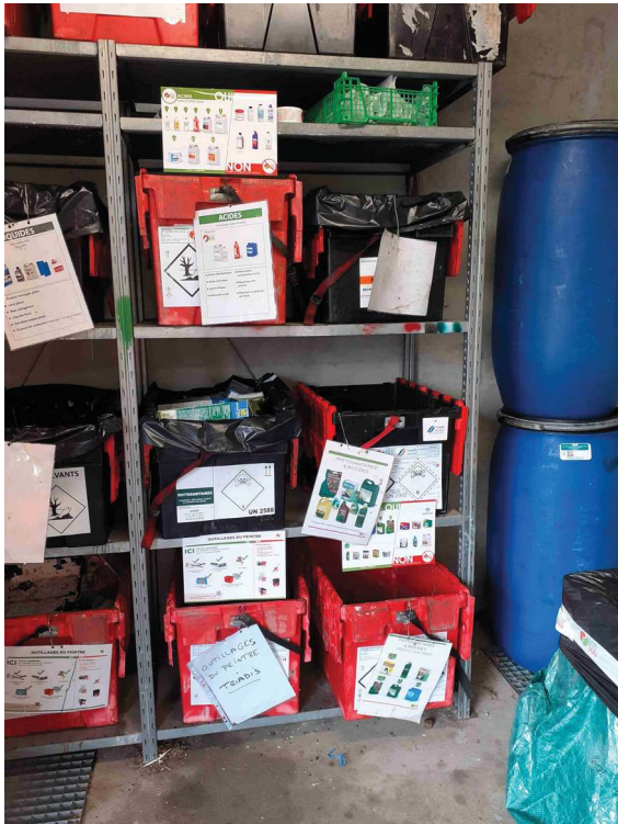
stockage déchets dangereux