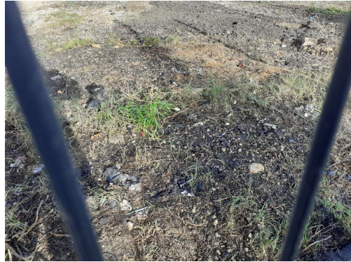
Traces d'hydrocarbures au sol