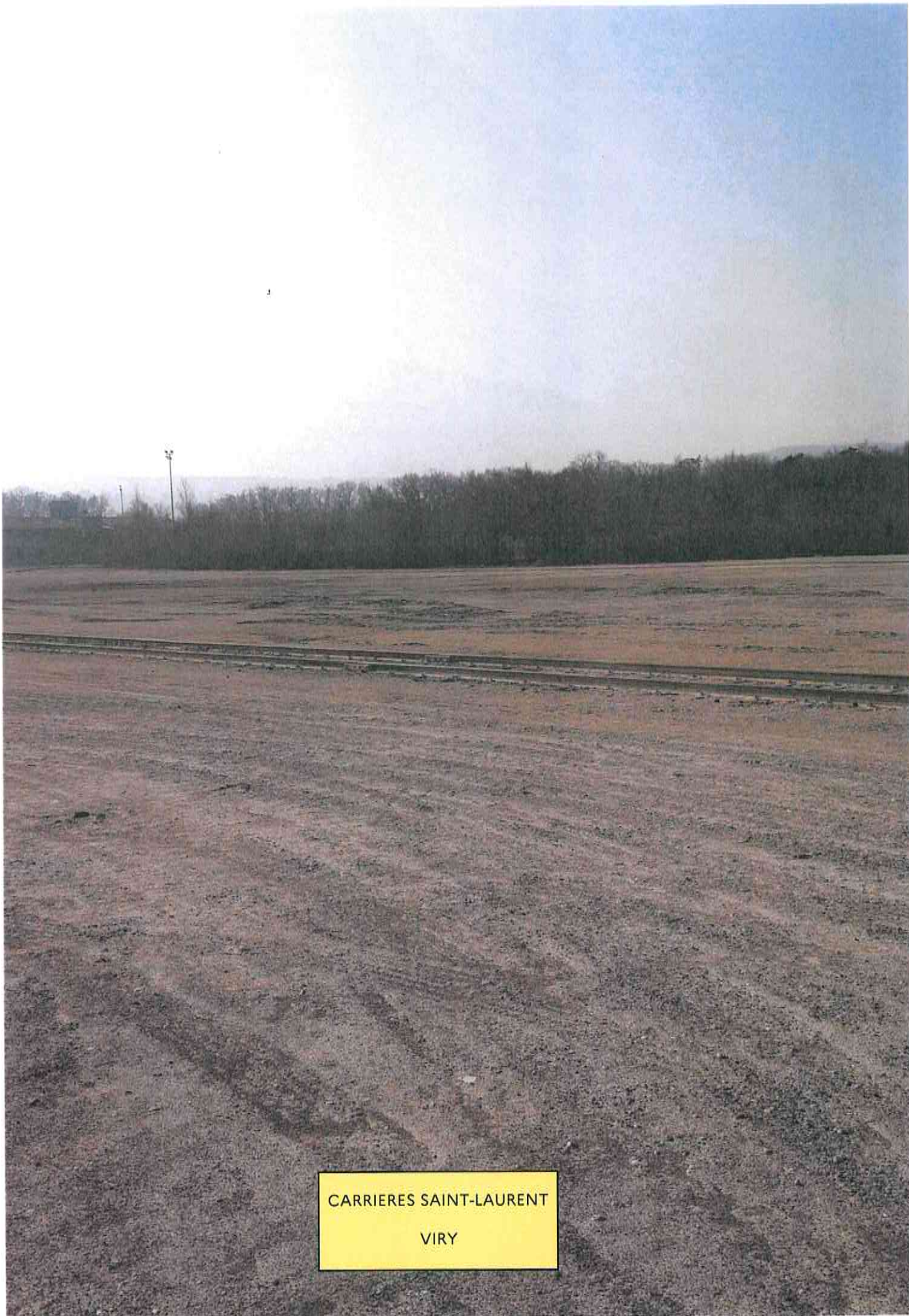
CARRIERES SAINT-LAURENT VIRY