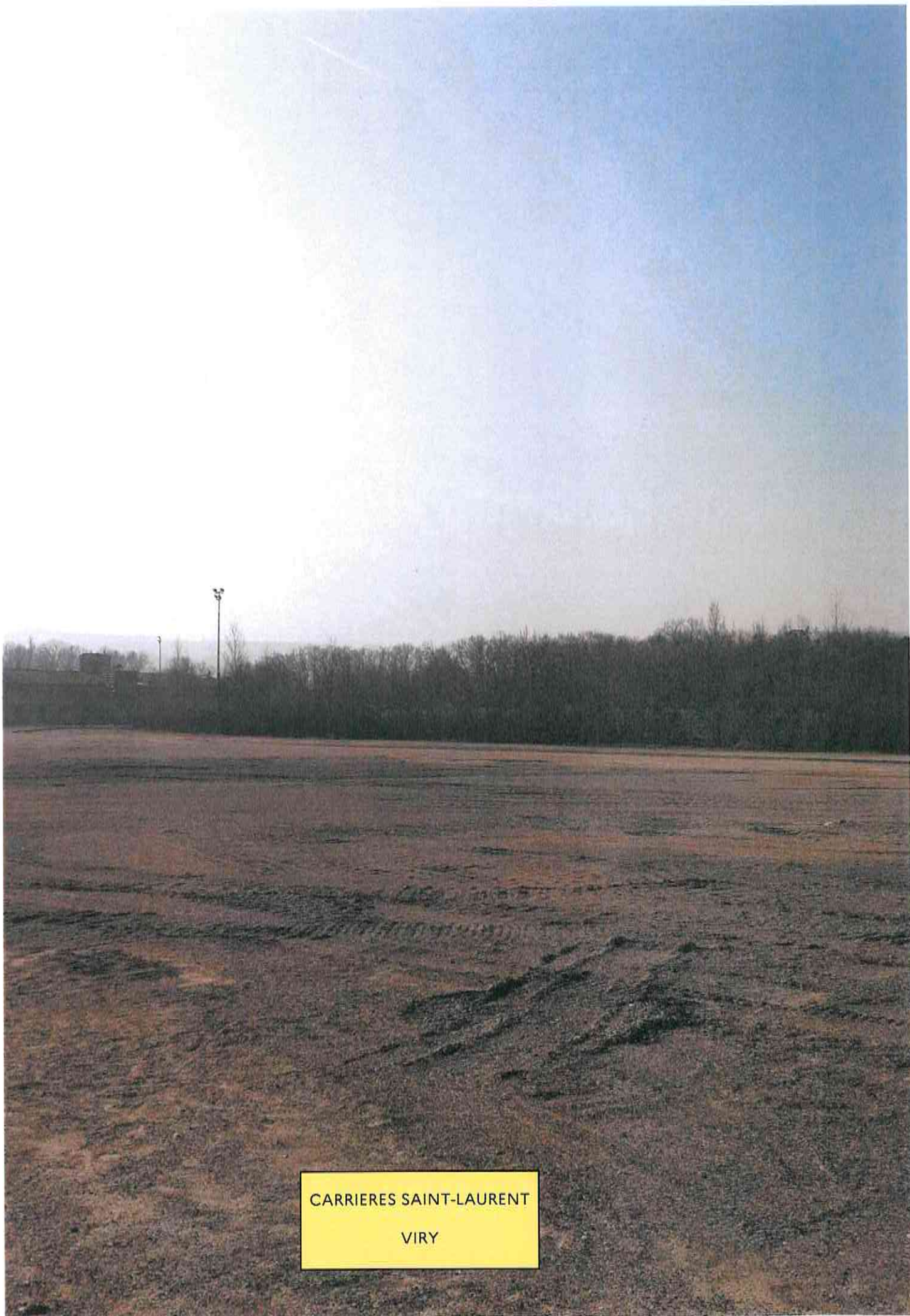
CARRIERES SAINT-LAURENT VIRY