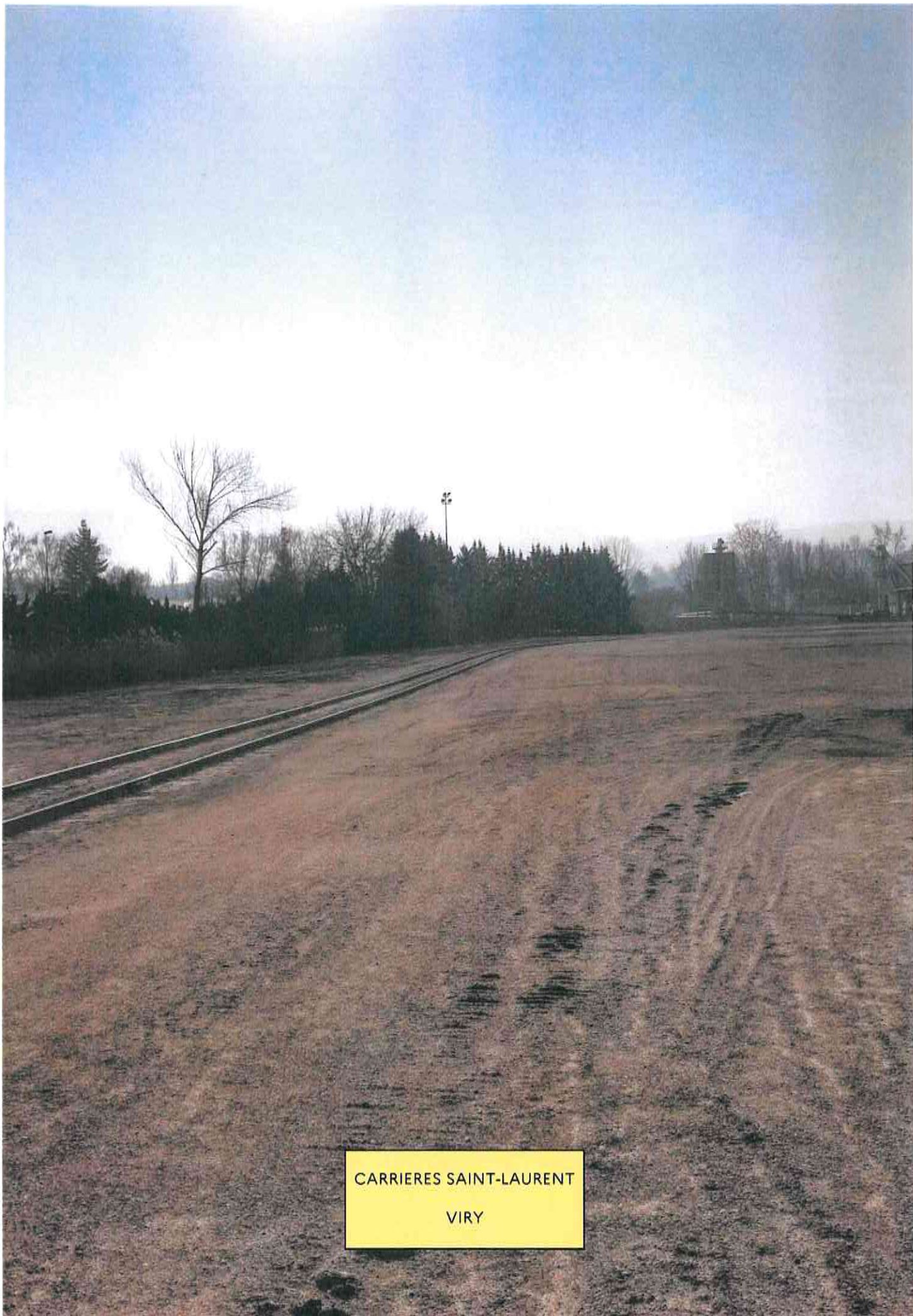
CARRIERES SAINT-LAURENT VIRY