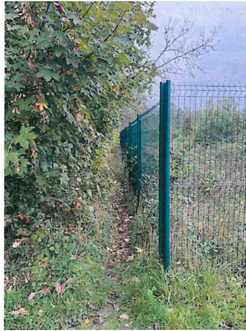
Figure 3: Accès au point d'aspiration n°908

Néanmoins, l'exploitant doit disposer d'un ou plusieurs appareils d'incendie publics ou privés, dont un implanté à 200 mètres au plus du risque, ou de points d'eau/bassins/citernes. Il a indiqué que le silo voisin TBG disposait d'un point d'aspiration (n°903) et qu'il souhaitait établir une convention avec TBG afin de pouvoir utiliser ce point d'aspiration en cas de besoin. Ce point d'aspiration se situe à moins de 200 m des capacités de stockage du site de la coopérative agricole SCA Puisseaux et à proximité immédiate du canal du Loing. Un accès pompier à ce dernier est présent.