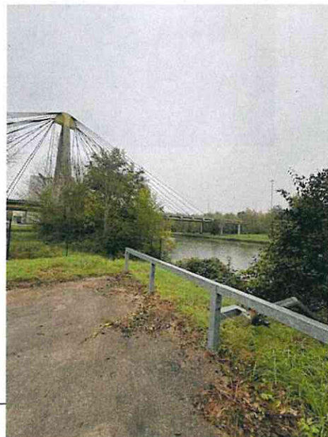
Figure 5: Accès pompier du point d'aspiration n°903