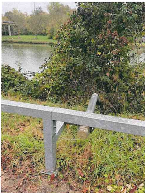
Figure 4: Point d'aspiration n°903

Néanmoins, l'exploitant doit disposer d'un ou plusieurs appareils d'incendie publics ou privés, dont un implanté à 200 mètres au plus du risque, ou de points d'eau/bassins/citernes. Il a indiqué que le silo voisin TBG disposait d'un point d'aspiration (n°903) et qu'il souhaitait établir une convention avec TBG afin de pouvoir utiliser ce point d'aspiration en cas de besoin. Ce point d'aspiration se situe à moins de 200 m des capacités de stockage du site de la coopérative agricole SCA Puisseaux et à proximité immédiate du canal du Loing. Un accès pompier à ce dernier est présent.