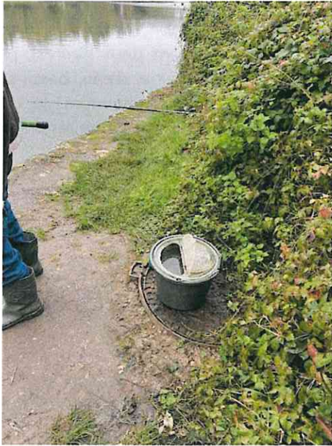
Figure 2: Emplacement du point d'aspiration n°908