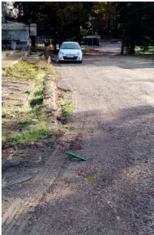
Photos du 02/12/2025 prises au droit de la tranchée