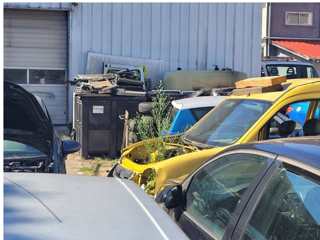
Véhicule hors d'usage et déchets divers