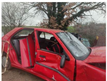
Stockage d'épaves automobiles