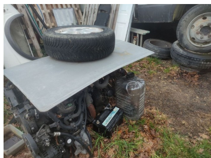
Pièces détachées et batteries stockés à sans rétention sur un sol non imperméable