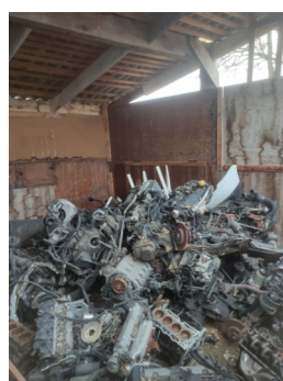
Stockage de pièces mécaniques à l'abri mais sans rétention associée