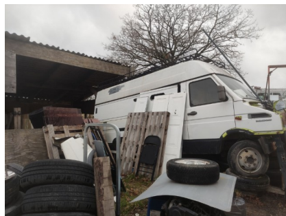
Véhicules non roulants stockés sur un sol non imperméable et pneumatiques