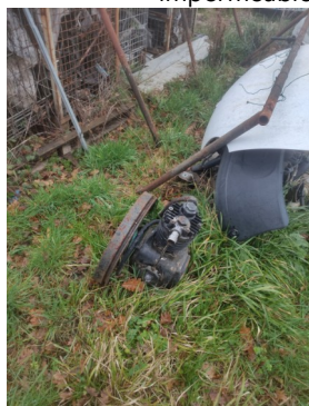
Stockage de pièces mécaniques sur un sol non étanche et sans rétention