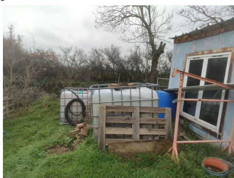
Présence de cuves