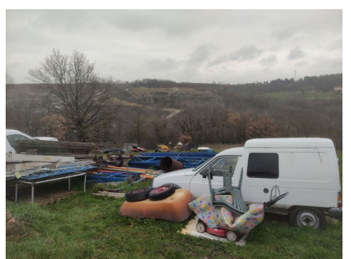
Présence de déchets métalliques