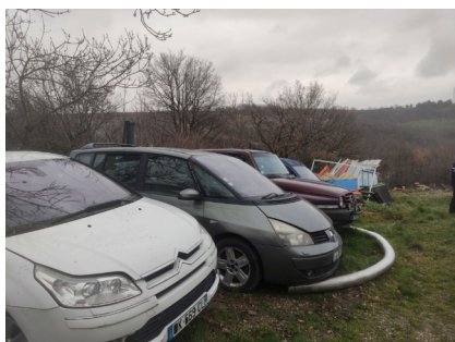
Véhicules non dépollués stockés sur un sol non imperméable