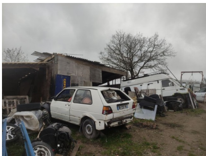
Véhicules non roulants stockés sur un sol non imperméable