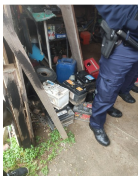
Présence de batteries stockées à l'abri mais sans rétention sur un sol non étanche