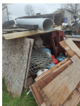
Stockage de bouteilles de gaz