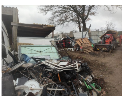
Stockage d'épaves automobiles