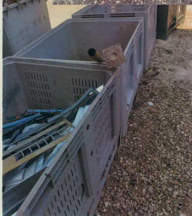
Bac pour pièces métalliques