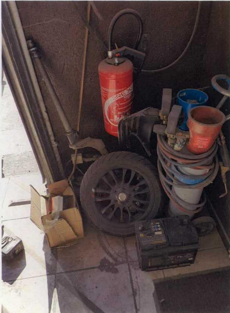
Extincteur + batterie pont