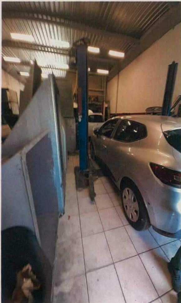
Vue sur le second pont