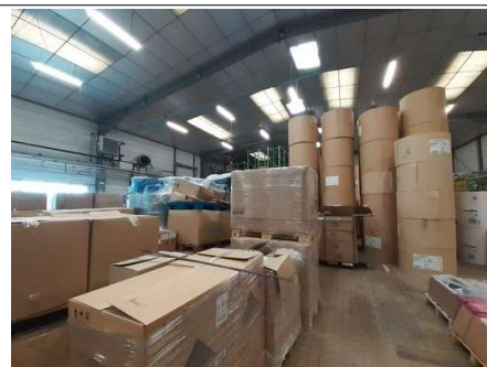
Stockages matières premières et rebus de fabrication