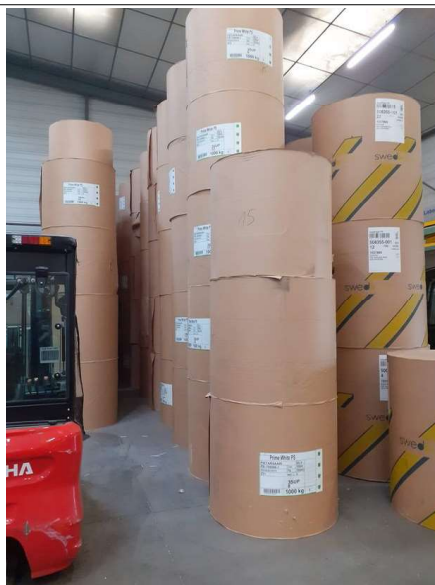
Stockages de bobines de papier