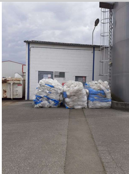
Stockage de DIB