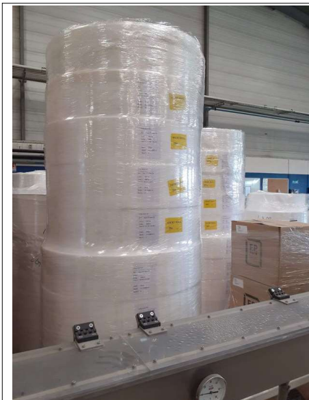
Stockages de matières premières pour les masques chirurgicaux