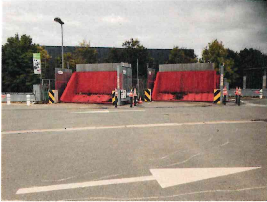
Dispositif anti-chute devant les bennes de déchets verts

N°1 : Prévention des chutes et collisions.