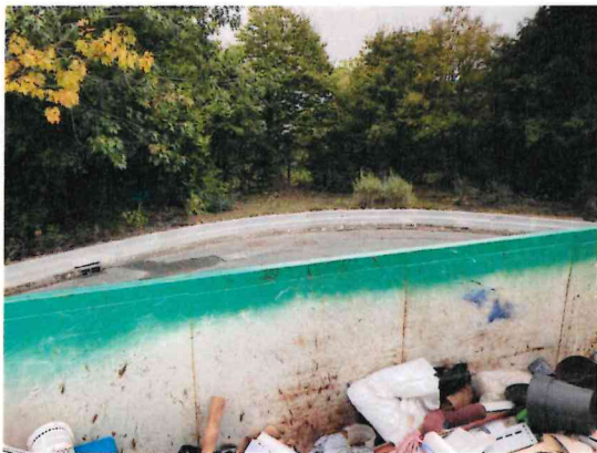
Digue périphérique en bas de quai pour le recueil des eaux d'extinction d'incendie