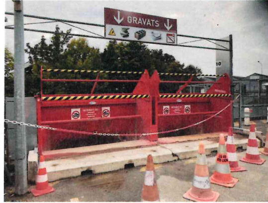
Dispositif anti-chute devant les bennes de gravats