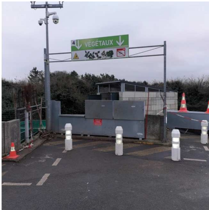
Signalétique pour piétons