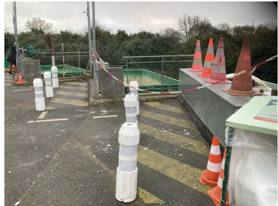
Signalétique pour piétons