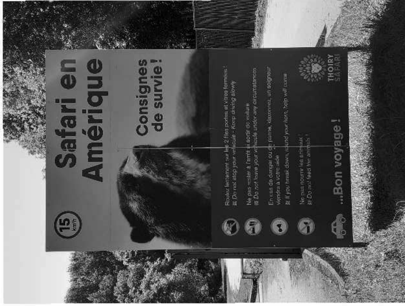
Photo n° 1 : Panneau de sécurité situé à l'entrée de l'enclos « Safari en Amérique »