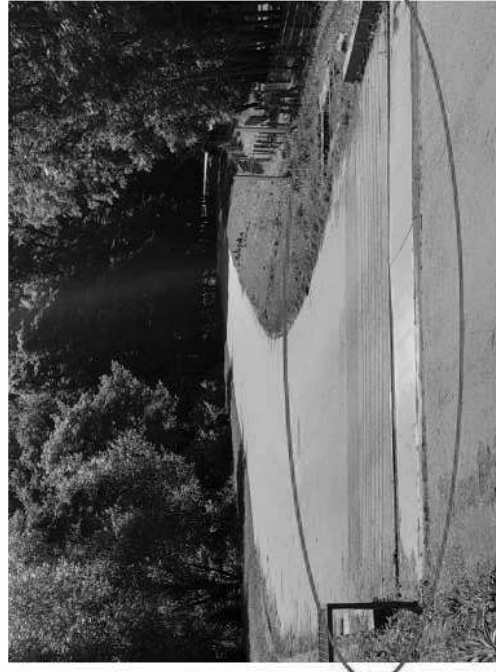
Photo n° 3 : Dispositif électrique prévenant l'évasion des animaux et permettant l'accès des véhicules, constitué d'une plaque électriflée et d'une dizaine de fils électriques tendus à environ 5 cm du niveau du sol