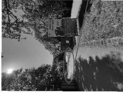
Photo n° 2 : Vue d'ensemble de l'entrée De l'enclos « Safari en Amérique »