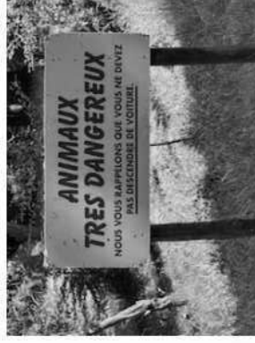
Photo n° 4 : Panneau de rappel de consignes, situé à l'intérieur de l'enclos à mi-parcours