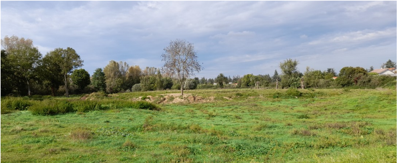
Figure 8: INSPECTION 09 OCTOBRE 2024 AVANT LA CRUE DU 17 OCTOBRE 2024