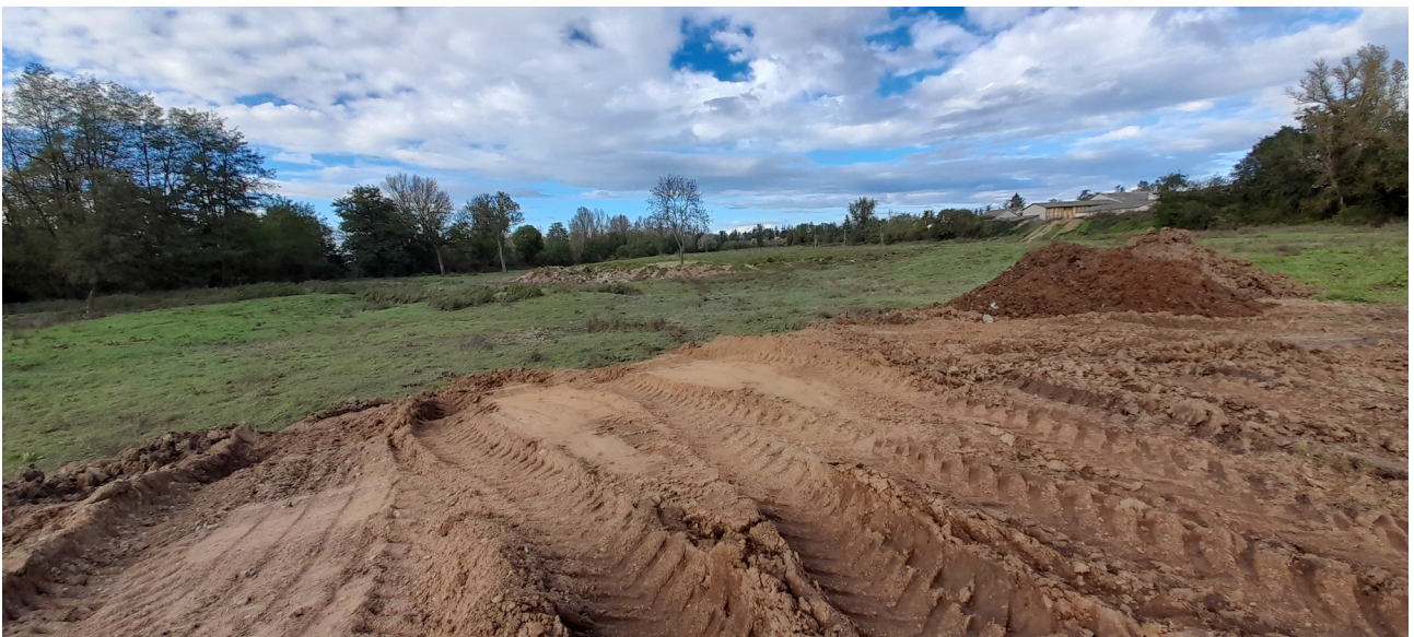
Figure 6: Photo 24/10/2024 Jour de la visite, après la crue du 17/10/2024

Les dépôts sur la parcelle OB873, visibles sur la photo précédente ont été régalés superficie et volume non définis