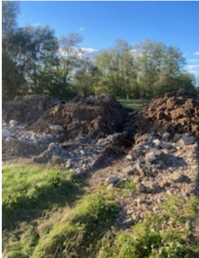
Figure 5: Dépôt sur parcelle OB873 réalisés entre le 9 et le 21 octobre 2024