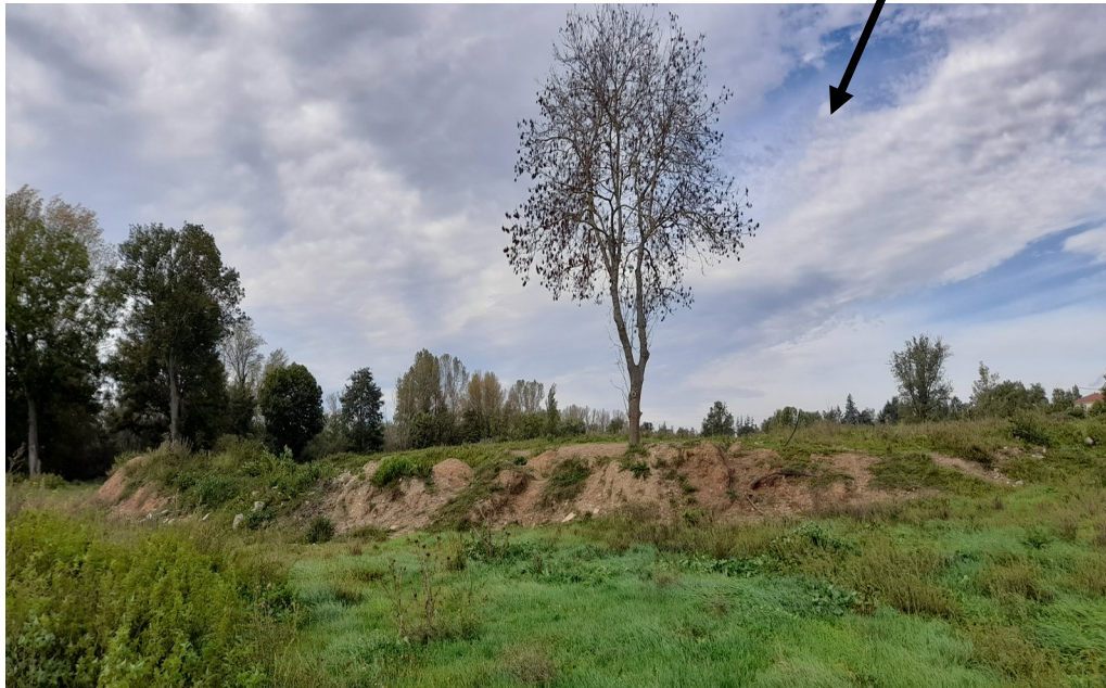
Figure 4: Photo 09/10/24 Parcelles OB1274 et OB872 hauteur 1 à 2 mètres