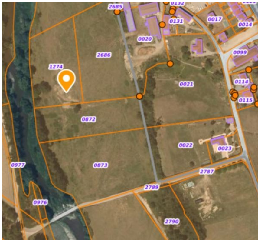
Figure 1: Parcelles OB1274, OB872,OB873