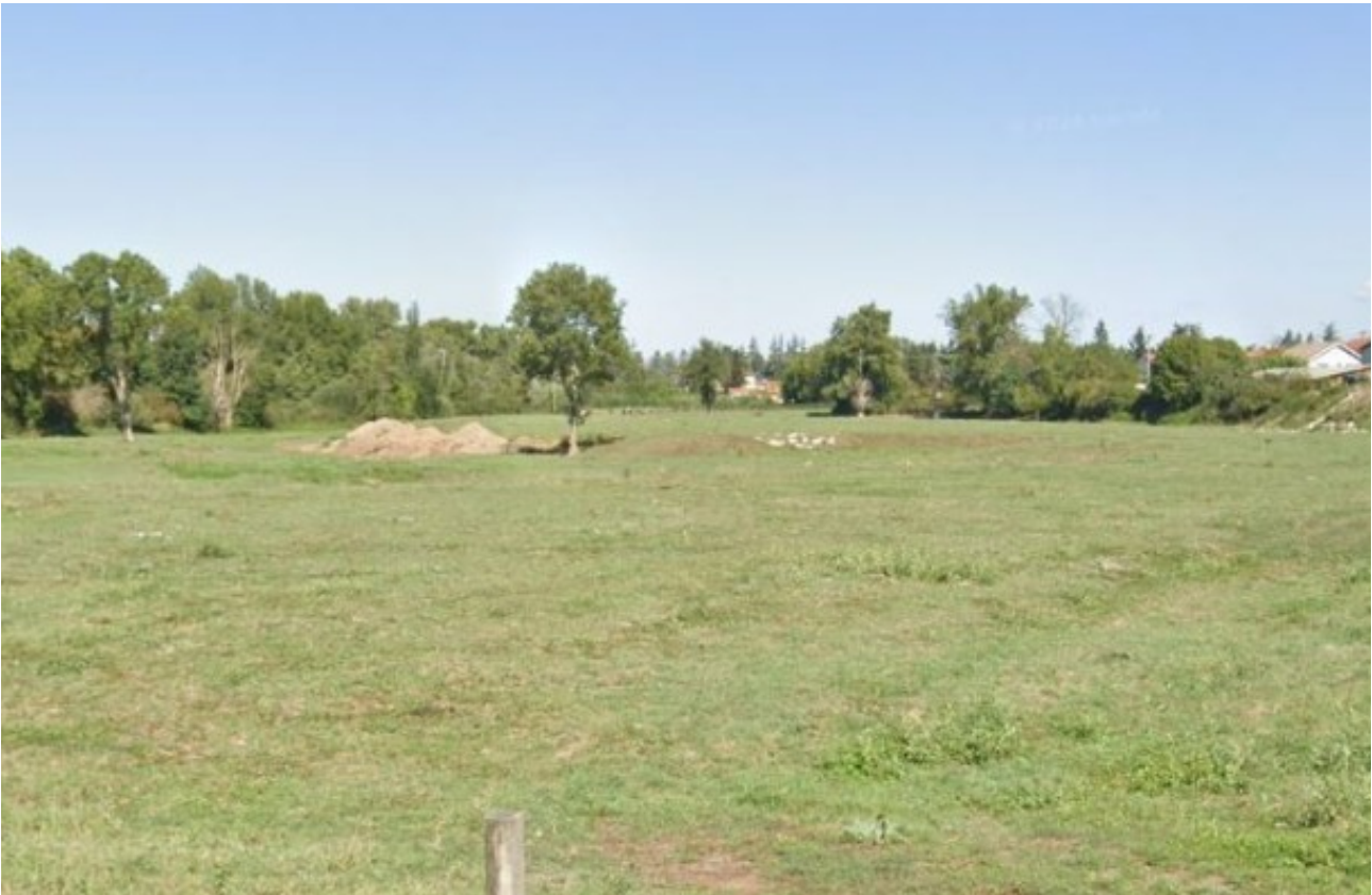
Figure 7: GOOGLE STREET JUIN22