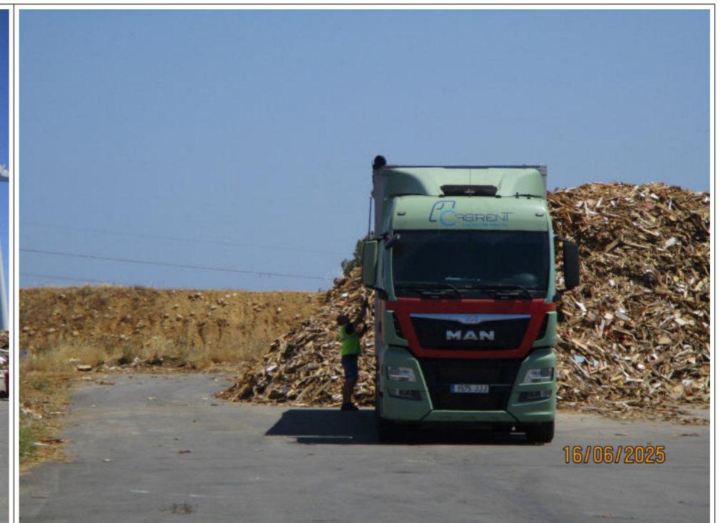
Dépôt de déchets de bois dont la hauteur n'excédait pas 4,5 m de haut le jour du contrôle – la hauteur du camion situé à proximité permet d'apprécier celle du dépôt de bois