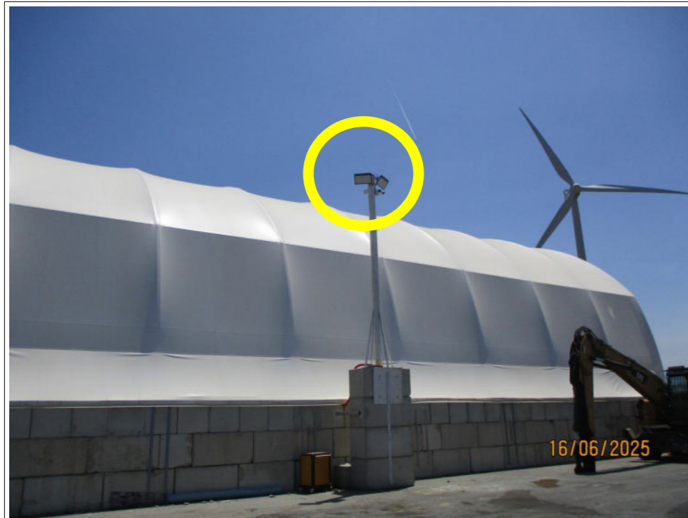
Caméra de surveillance installée du côté de l'entrée de la plateforme et couvrant cette partie de l'établissement

Photographies prises par l'inspection des installations classées lors du contrôle du 16/06/2025 dans la plateforme de transit, regroupement, tri et traitement de déchets non dangereux que la société NYTTTRAE exploite route départementale n° 614A, lieu-dit "La Fossa" à Baixas (66390)