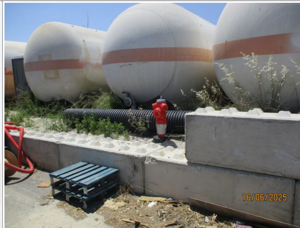
4 cuves d'un volume de 120 m 3 chacune, contenant l'eau destinée à la lutte contre l'incendie