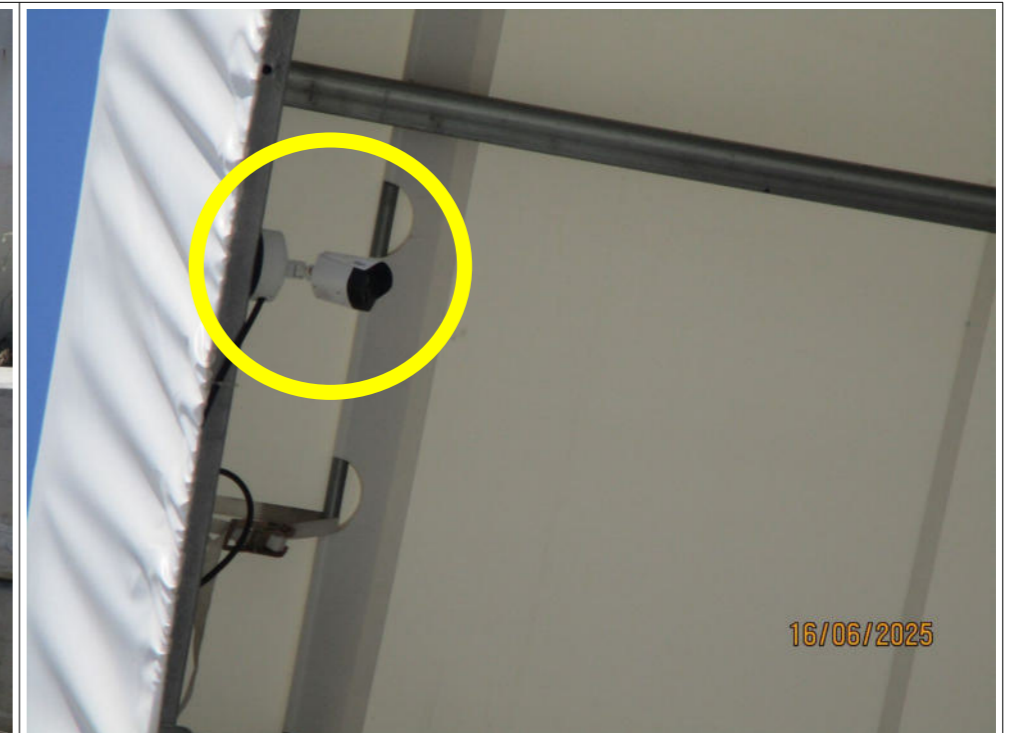
Caméra thermique installée au niveau du toit de l'abri en forme de tunnel