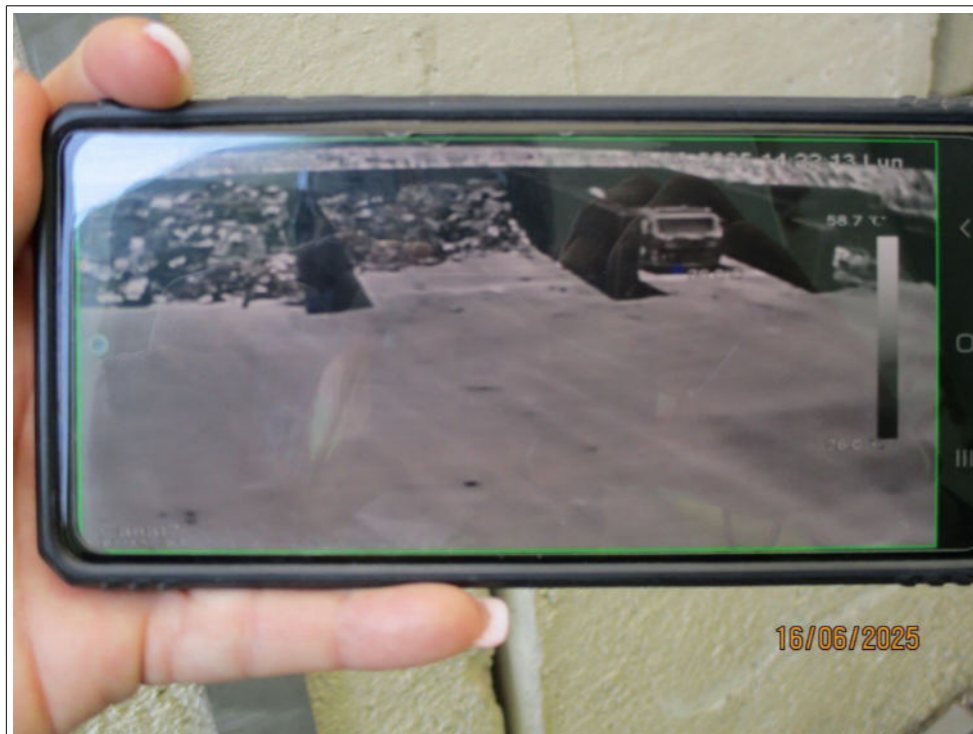
Retour vidéo sur le smartphone de l'exploitant de la caméra de surveillance installée du côté de l'entrée de la plateforme