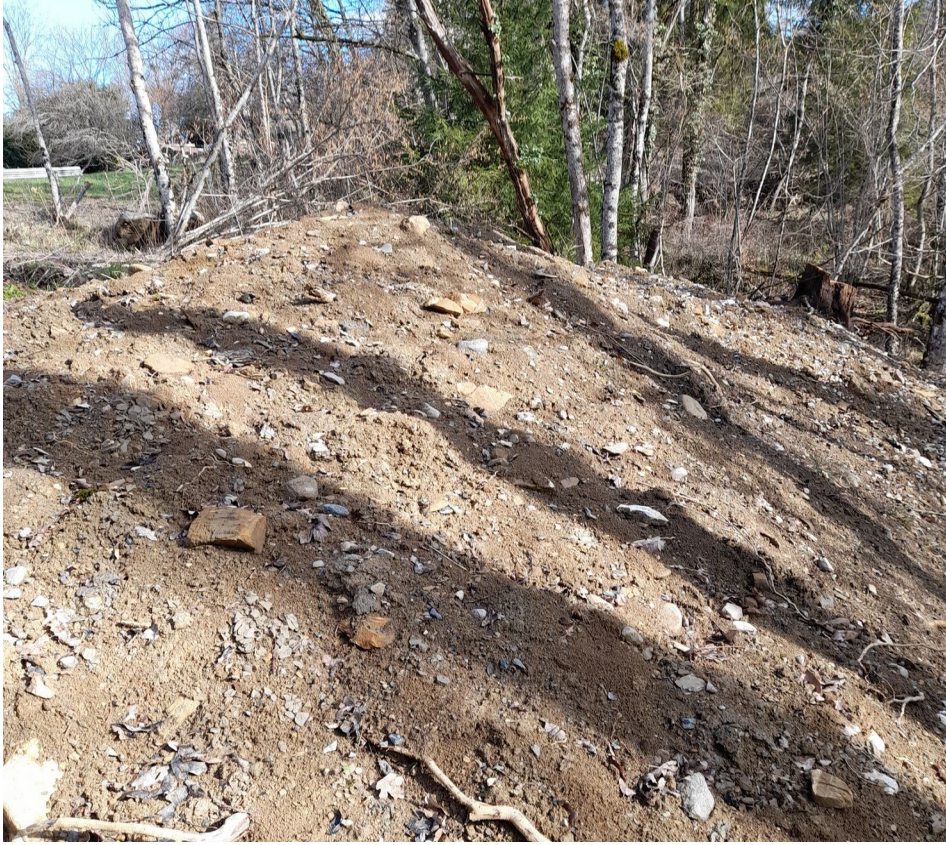
N°10– Photo glissement des remblais