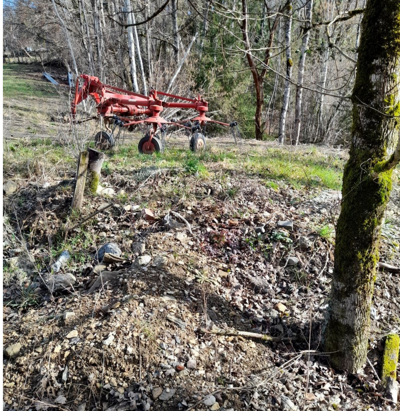
N°8- Photo Haut du talus