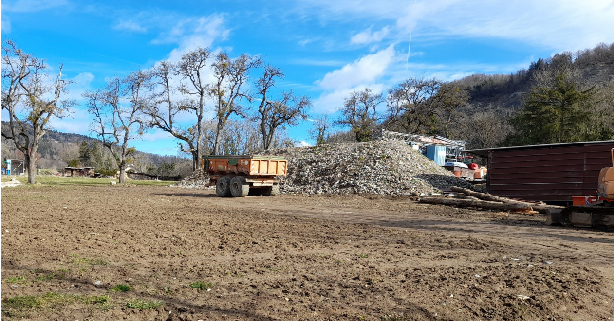
N°2 – Photo merlon – vue derrière