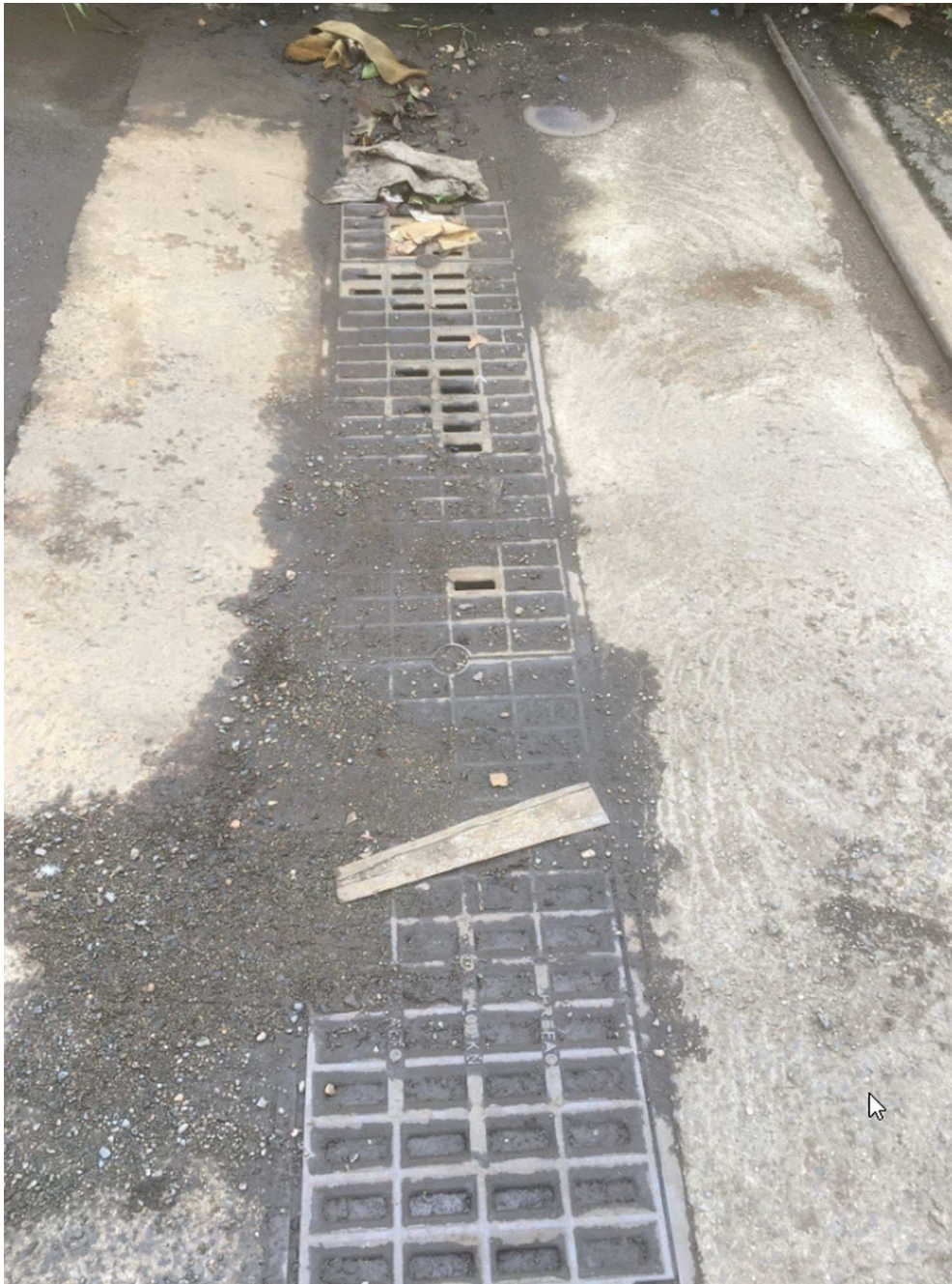
Grille de collecte des eaux de ruissellement en sortie de site.