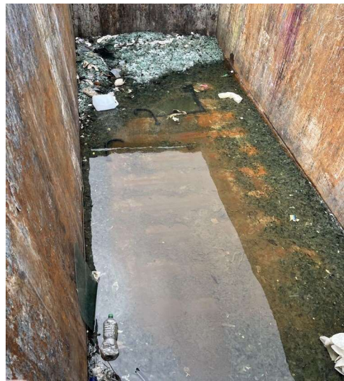
Bennes à déchets présentes sur site