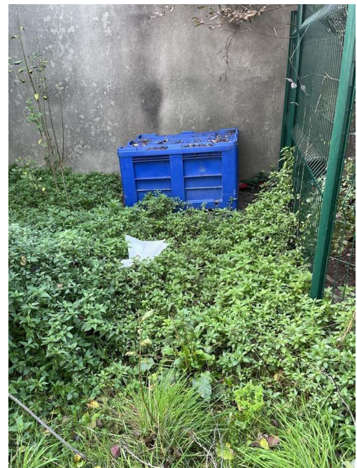
Déchets à évacuer