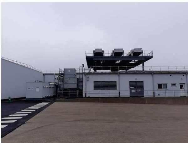
Condenseurs en toiture

Il est toutefois constaté sur le terrain que ces équipements sont notamment composés de condenseurs situés en toiture (cf. photo ci-dessous), en milieu non confiné. Il apparaît, dès lors, que la mise en place d'un système permanent de détection de fuite est techniquement impossible.