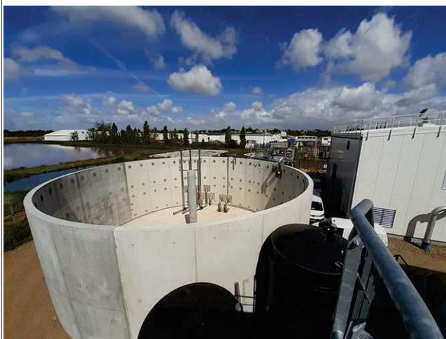
Bassin tampon et local « boues »

Enfin, l'inspection des installations classées note que les moyens financiers consacrés à ce chantier et l'engagement du personnel de l'établissement, avec en particulier le suivi du chantier par l'ingénieure procédés du site, a permis jusqu'à présent de tenir le planning des travaux malgré l'ampleur et la complexité du chantier.