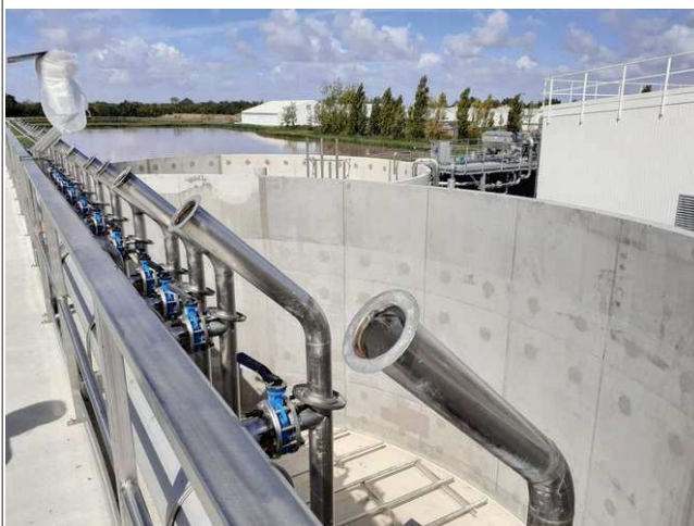
Bassin biologique (dispositif d'injection d'air)