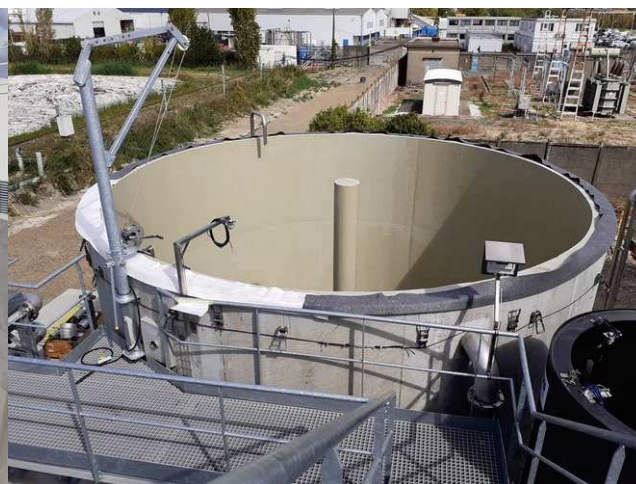
Silo à boues (couverture à venir)