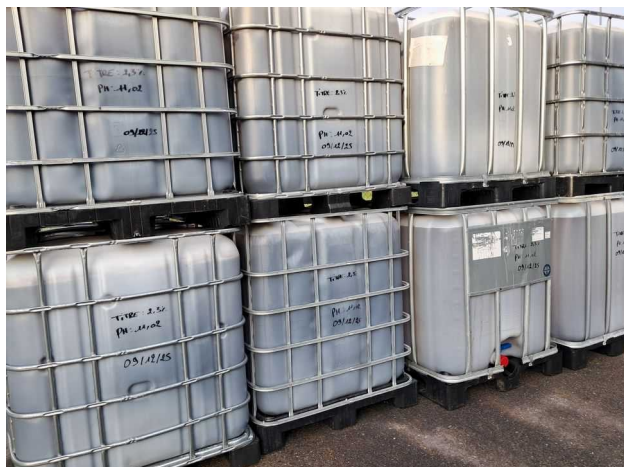
GRV avec étiquetage non-conforme