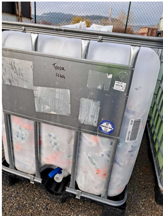
GRV sans étiquetage