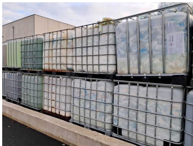
GRV contenant des berlingots fuyards d'eau de Javel et non référencés dans l'état des stocks

L'exploitant doit disposer d'un état des stocks conforme aux produits et déchets présents effectivement sur site.