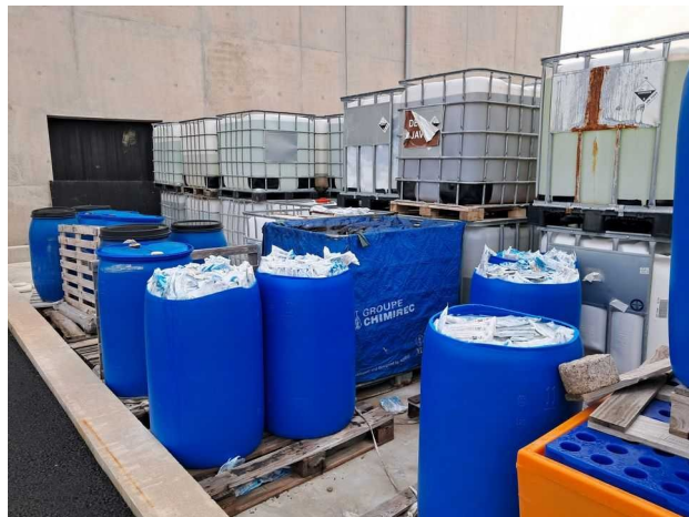
Fûts et GRV sans étiquetage ou avec étiquetage non-conforme