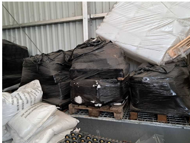
Déchets sous l'auvent de stockage des emballages plastiques

L'exploitant doit faire éliminer ses déchets au fur et à mesure de leur production. Il est rappelé que le stockage supérieur à 1 an de déchets est interdit sur ce site. Les cinq palettes de déchets, filmées en noir et stockées sous l'auvent Sud, doivent faire l'objet d'une élimination dans une filière adaptée d'ici le 31/01/2026.