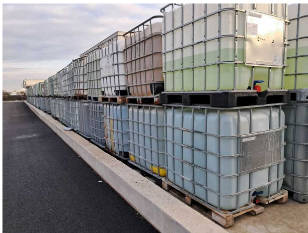
Zone de stockage GRV Nord-Ouest dont une partie n'est pas référencée dans l'état des stocks

L'exploitant n'a pas répondu à la mise en demeure.