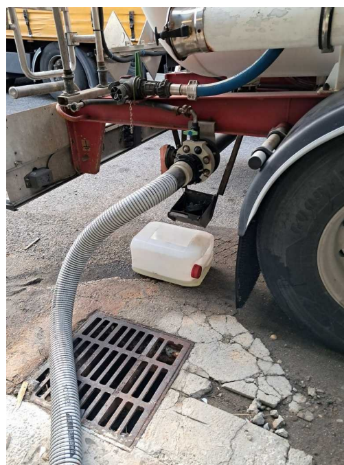
Arrière de la citerne en cours de dépotage au-dessus d'un avaloir d'eaux pluviales

L'exploitant doit réaliser ses opérations de dépotage uniquement sur des zones aménagées correctement à cet effet, étanche et relié à une rétention correctement dimensionnée sous 15 jours.