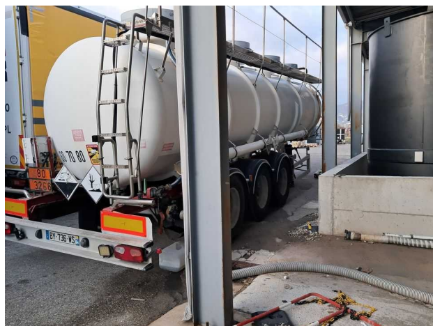
Zone de dépotage non-conforme au Sud du bâtiment de production