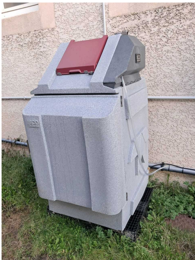
Préleveur automatique réfrigéré

L'exploitant n'a pas répondu à la mise en demeure.