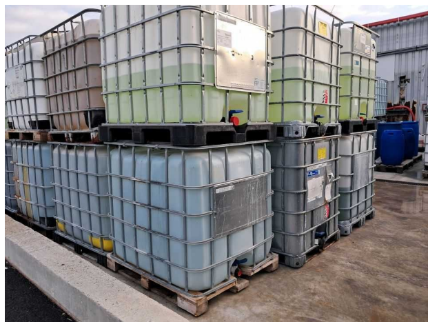
GRV avec étiquetage non-conforme ou sans étiquetage

L'exploitant doit disposer de fûts, réservoirs et autre emballages comportant en caractères très lisibles le nom des substances et mélanges, et s'il y a lieu, les éléments d'étiquetage conformément au règlement n°1272/2008 dit CLP ou le cas échéant par la réglementation sectorielle applicable aux produits considérés (nom, mentions de dangers, conseils de prudence).