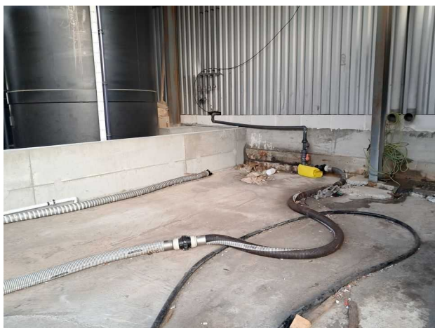
Zone de dépotage sous l'auvent