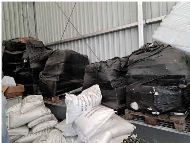
Déchets sous l'auvent de stockage des emballages plastiques

Une palette comporte des seaux, ce qui laisse penser l'inspection qu'il s'agit de déchets historiques encore non éliminés. Aucun étiquetage ne vient indiquer le contenu de ces déchets. Pour rappel, ces déchets historiques avaient pourtant fait l'objet d'une campagne d'élimination par l'exploitant à la suite des mises en demeure du 14/01/2022 et du 10/05/2023 ; les bordereaux d'élimination de déchets avaient été transmis à l'inspection pour justifier de cette élimination (environ 31 tonnes).