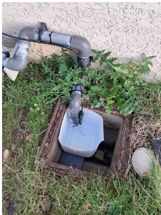
Point de prélèvement au dernier regard de rejet