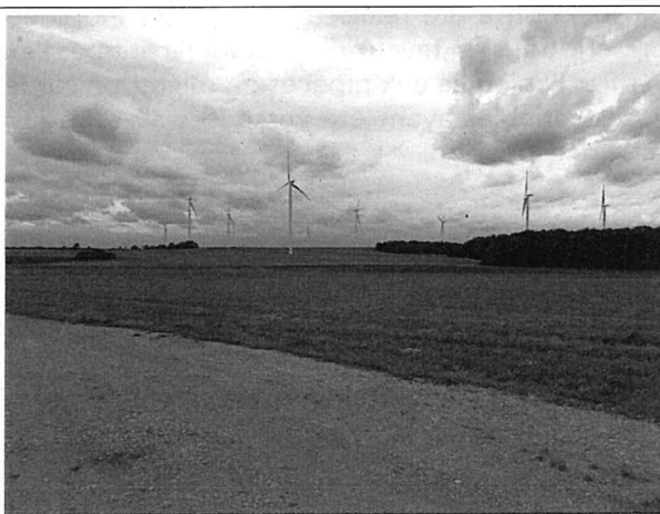
Bordure reprise de la plateforme E14 et reste du parc à l'arrêt