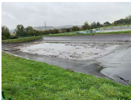
Bassin de confinement le 13/10/2022