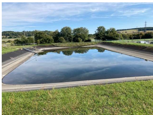
Bassin de confinement le 22/09/2022