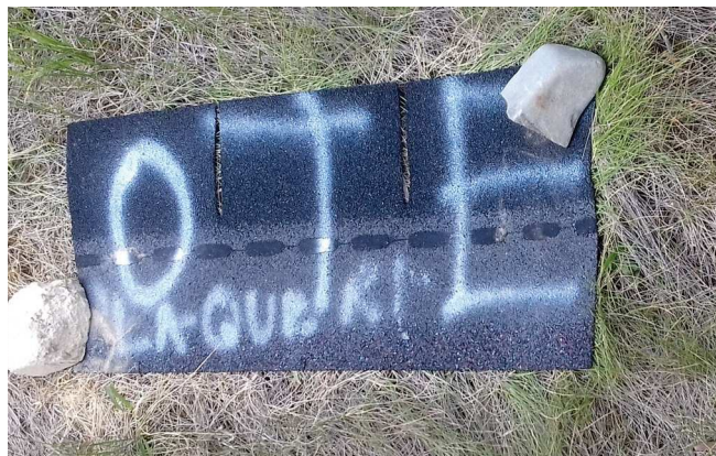
Plaques à reptiles/amphibiens N° 1 & 2