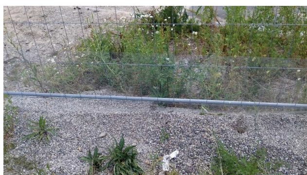
Hauteur gravier insuffisante