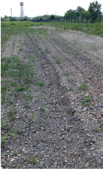
Ornières / Sol graveleux