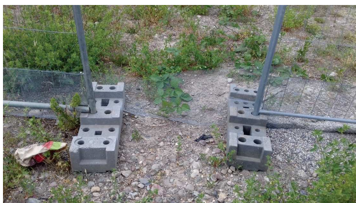
Discontinuité Porte Sud