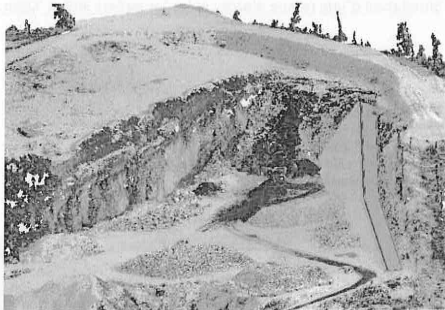
Vue 3D de la simulation

Dressé par M. Thomas DALSTEIN Géomètre-Expert salarié