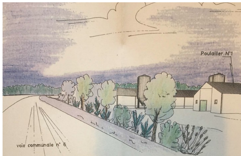
Illustration de la proposition de haie bocagère côté Nord

Il fournit l'illustration suivante de la plantation côté Nord qu'il propose de créer d'ici au printemps 2023 :