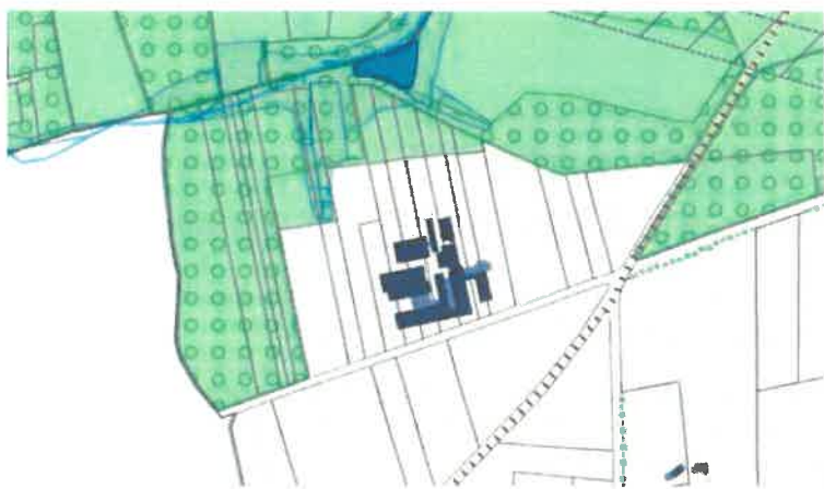
Extrait du PLU 2023 source commune