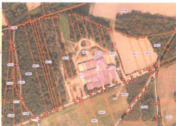
Etat boisé fond photo aérienne 2023