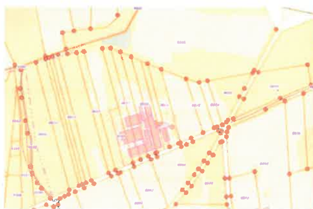
Etat boisé fond IGN