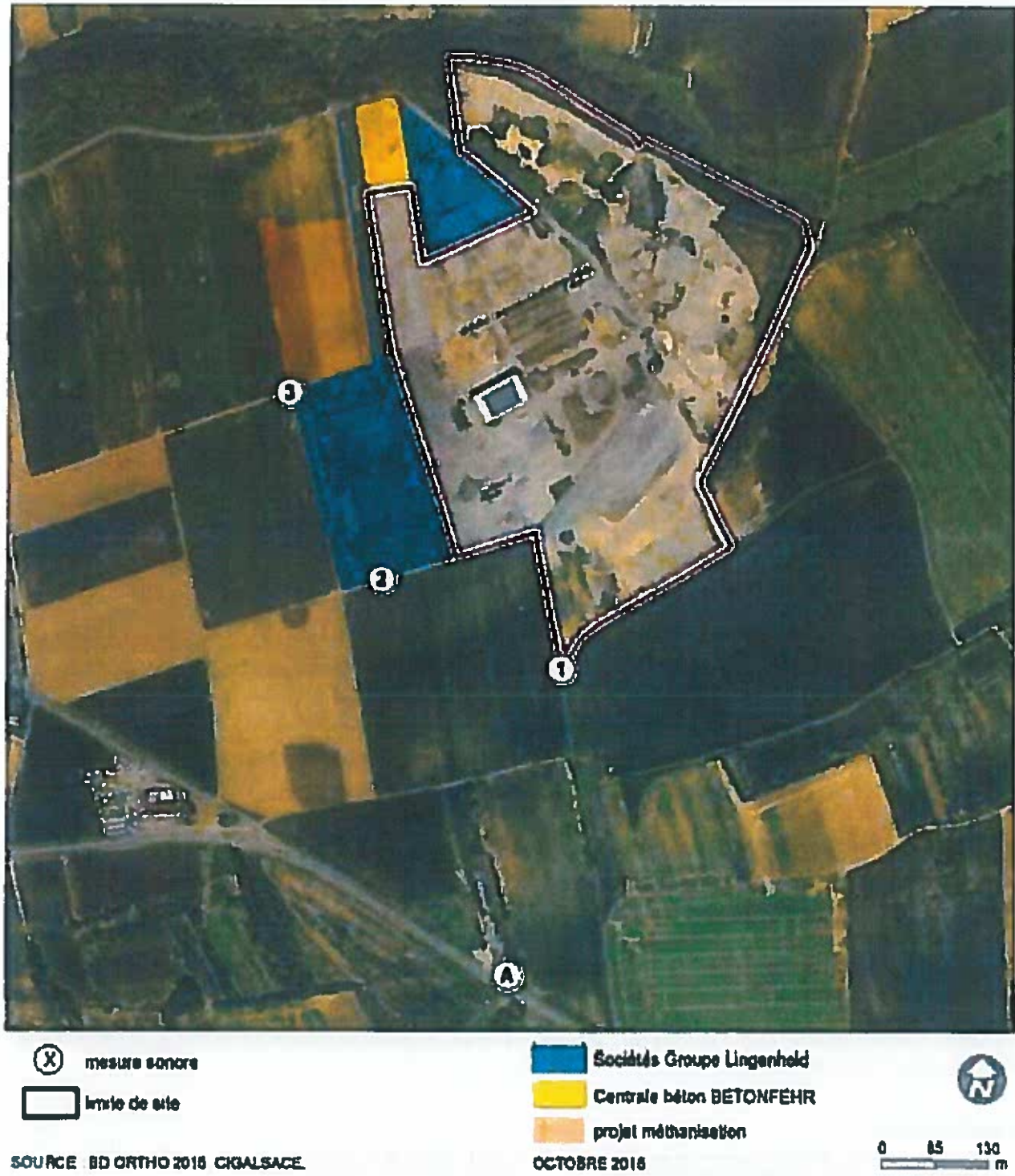
Figure 1 : Localisation des points de mesures sonores