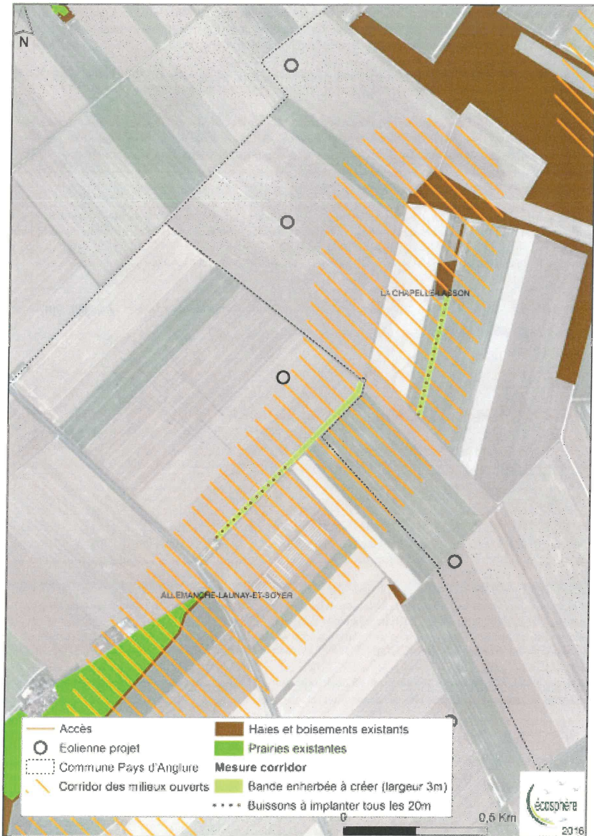
Carte 39 : Mesure corridor écologique s'appuyant sur le SRCE