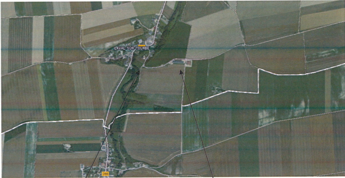
Commune de LAVAL SUR TOURBE