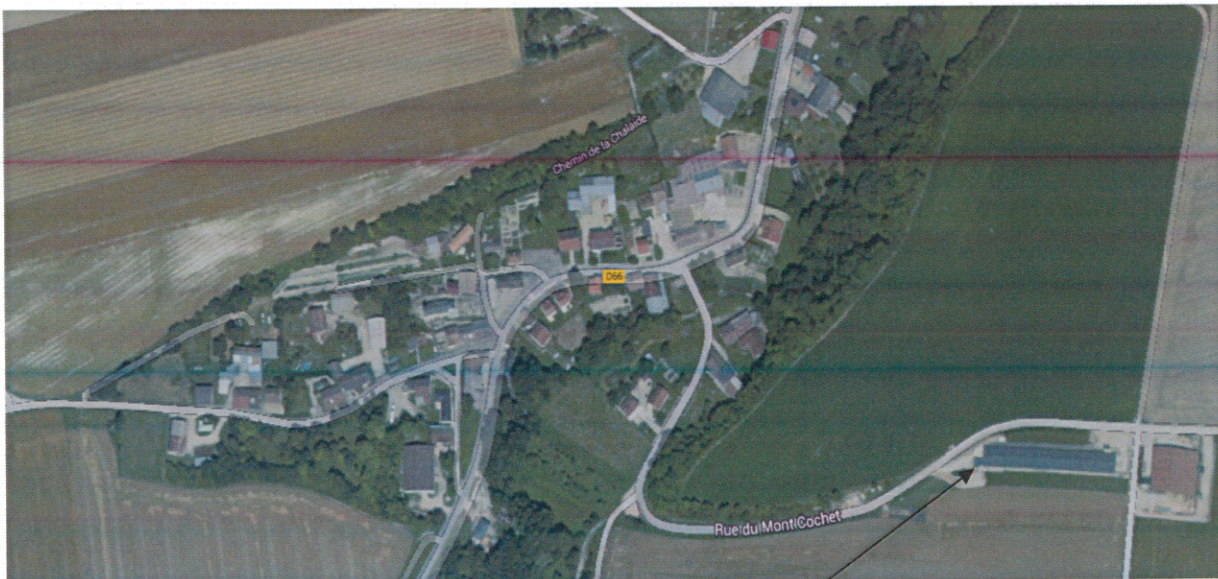
EARL de la FORGE Elevage de volailles (existants)